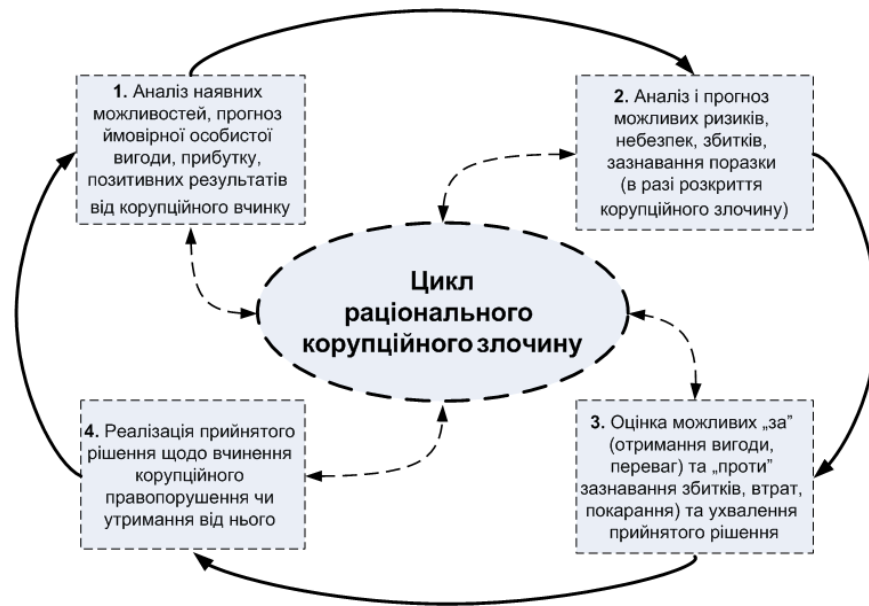
Рис. 1. Циклічність етапів раціонального корупційного злочину за Г.Беккером [9]

Г.Беккер вважає, що будь-яка службова особа, якій випадає нагода чи можливість вступити в корупційні зв'язки, завжди аналізує та оцінює потенційні (мінімально виправдані) прибутки від корупційних дій щодо очікуваних (максимально виправданих) втрат від таких дій у разі розкриття злочину та притягнення її до відповідальності. На його думку, окремі люди наважуються на скоєння злочину тому, що це дає їм можливість отримати більш вагомні фінансові та інші переваги порівняно з легальною діяльністю, враховуючи при цьому ймовірність викриття, арешту та судового вироку, а також суворість покарання.