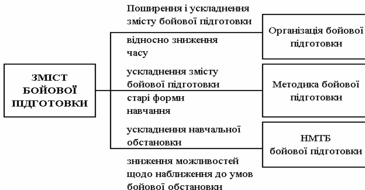
Рис. 2. Стимування розвитку змісту бойової підготовки (навчання)

розвитку того чи іншого компоненту бойової підготовки, а самі компоненти (рис.2).