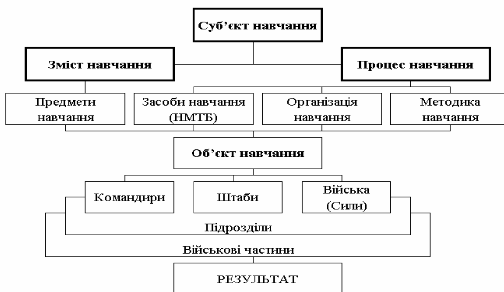
Рис. 1. Система бойової підготовки

Схематично система бойової підготовки показана на рис. 1.