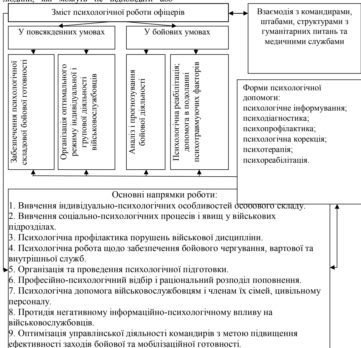
Рис. 1. Зміст роботи офіцерів соціально-психологічної служби

Завдання та зміст професійної підготовки майбутніх офіцерів соціально-психологічної служби визначається, на нашу думку, вимогами до майбутньої професійної діяльності. Нами було проаналізовано базові компоненти діяльності психолога Збройних Сил України (див. рис. 1).