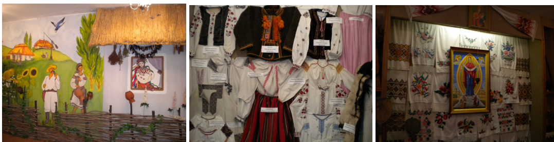
Рис. 3. Кабінет народознавства

Активну участь прийняли студенти технікуму у конкурсі живих картин (рис. 4 а,б), який проводився в позаурочний час. Викладачем були вибрані репродукції картин відомих художників і поставлена