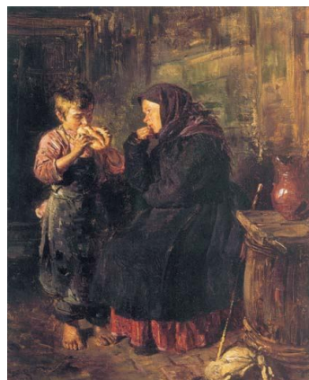
Рис. 4,б. Володимир Маковський. «Побачення»

Висновки. Підвищення компетенції викладача, створення відповідної навчально-матеріальної бази предмета, проведення позаурочних заходів з предмета