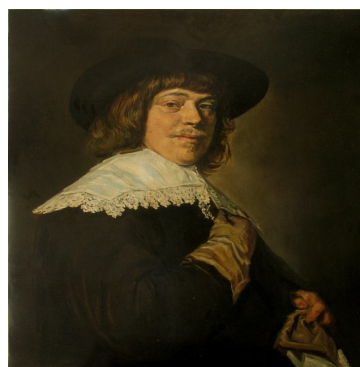
Рис. 4,а. Франс Гальс. «Портрет молодого чоловіка»