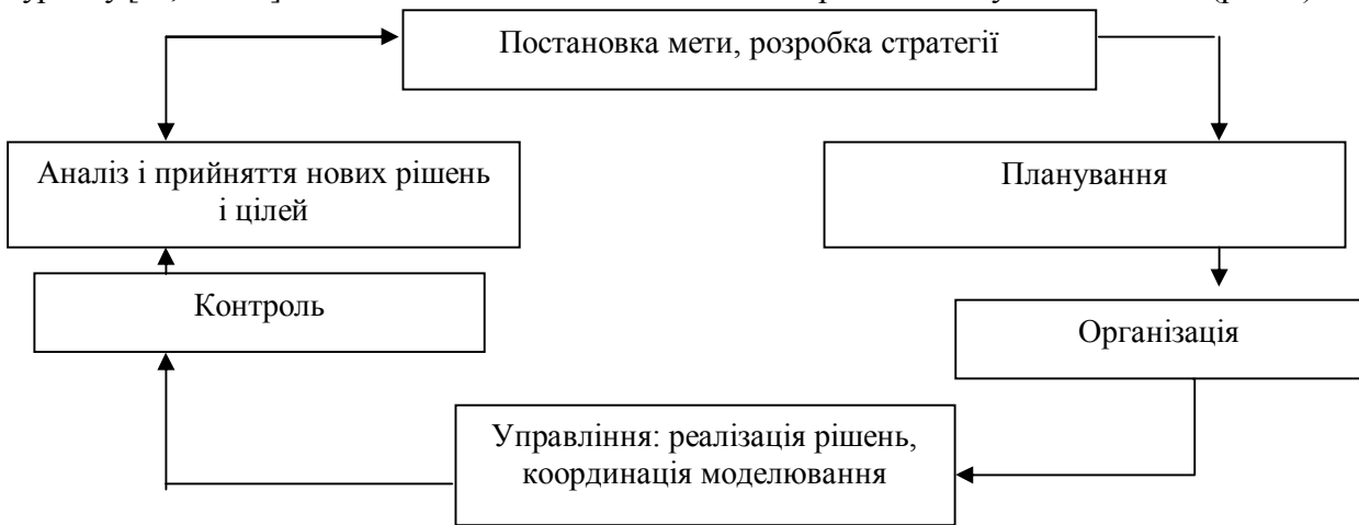
Рис.1 Функціональна модель менеджменту

Отже, модель менеджменту можна відтворити за наступною схемою (рис. 2).