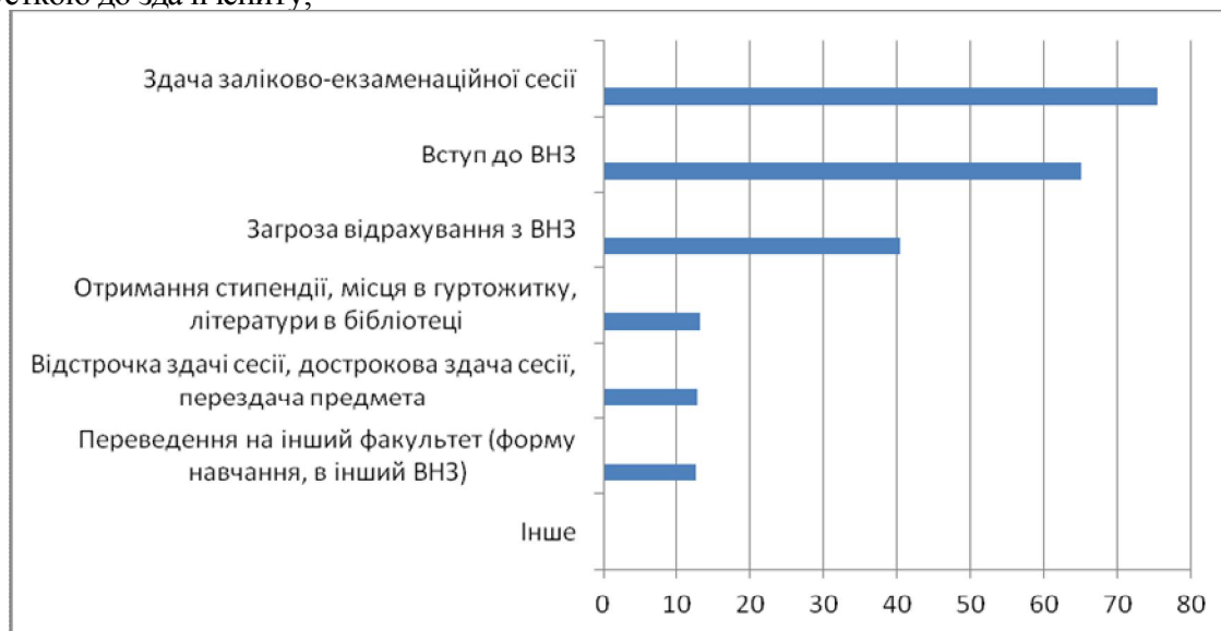
Рис. 2. Дані про форми корупційних діянь у вищій школі [11].

Українські дослідники запропонували форми корупційних діянь класифікувати, як показано на рис.2.