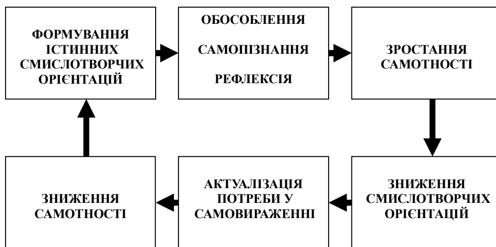
Рис. 2 Механізм переорієнтації самотності

при їх зниженні буде втрачений, а відповідно такий смисл не інтегрований у особистісний досвід людини. Зростання механізмів психологічного захисту призводить до підвищення рівню самотності, оскільки дане переживання обумовлене самопізнанням і має сигнальну функцію щодо невиявленої потреби у самовираженні. Враховуючи результати усіх частин емпіричного дослідження ми схематично зобразили механізм перенаправлення самотності для сприяння розвитку особистості, що відображає виявлені кореляції.