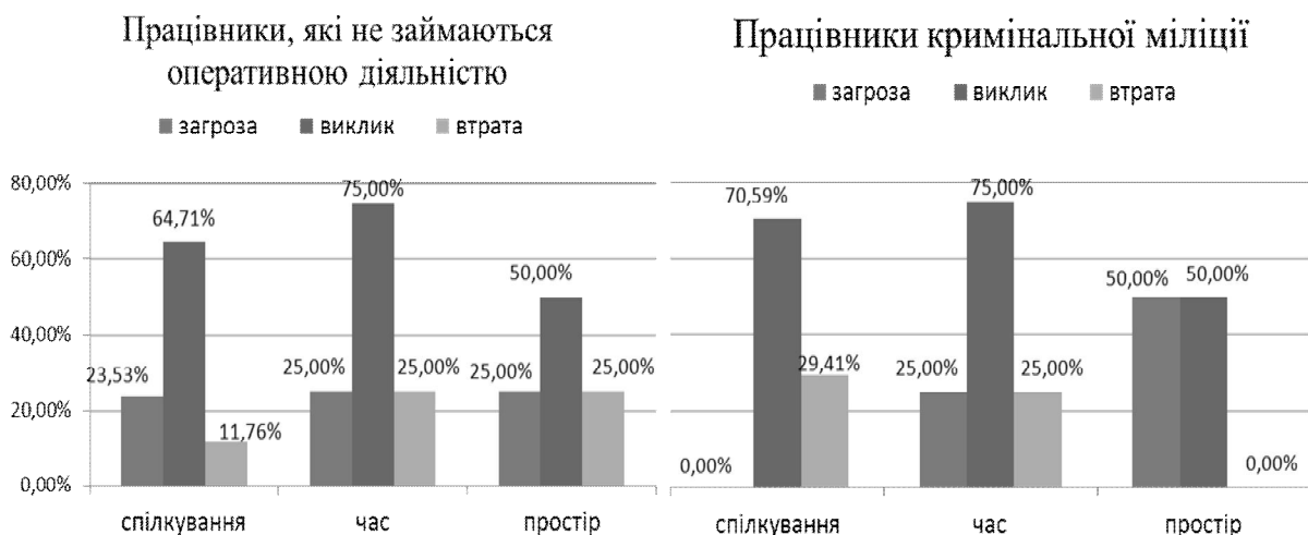
Рис 1. Порівняльна характеристика стресогенності типових ситуацій службової діяльності працівників ОВС (у % від кількості ситуацій).

Особливості сприйняття працівниками ОВС типових ситуацій службової діяльності обумовлюють особливості поведінки та переживань в цих ситуаціях. Результати дослідження представлені на рис. 1.