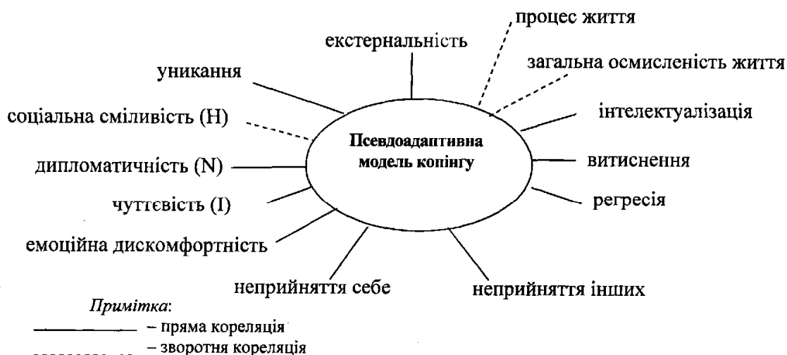
Рис. 2. Структура індивідуально-психологічних особливостей псевдоадаптивної моделі поведінки фахівців ДКВСУ в стресових ситуаціях

Встановлено, що особливості псевдоадаптивного типу копінг-поведінки працівників ДКВСУ можуть бути обумовлені орієнтацією на уникання в стресовій ситуації ( r=0,35 , при p \leq 0,01 ) – позитивний помірний взаємозв'язок; використанням захистних механізмів: інтелектуалізація ( r=0,30 , при p \leq 0,01 ), витиснення ( r=0,46 , p \leq 0,01 ), а також регресією до більш раннього, інфантильного стилю поведінки ( r=0,38 , при p \leq 0,05 ) – помірні позитивні зв'язки.