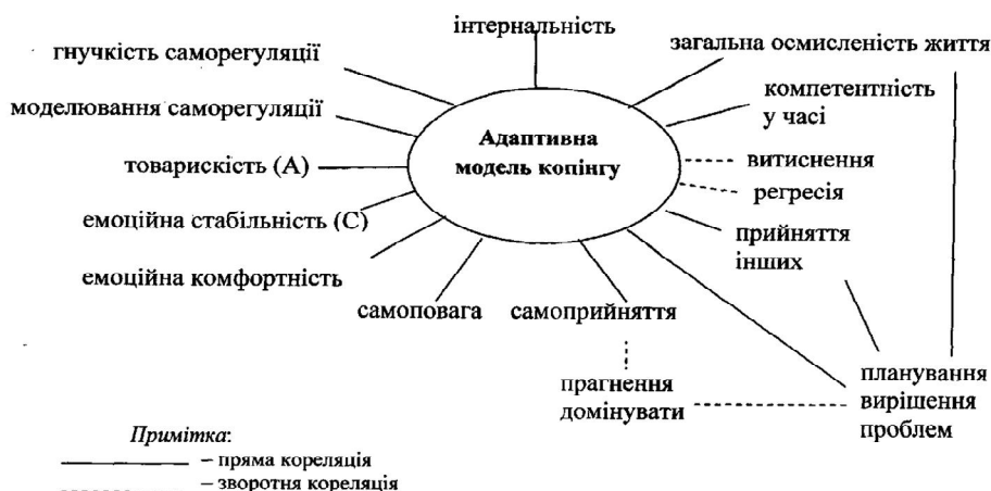
Рис. 1. Структура індивідуально-психологічних особливостей адаптивної моделі поведінки фахівців ДКВСУ в стресових ситуаціях

визначає рівень інтернальності особистості (див. рис. 1). Отримано позитивний кореляційний взаємозв'язок між адаптивністю стрес-долаючої поведінки пенітенціаристів та показниками інтернальності декількох методик: 1) таких шкал СЖО, як локус контроль - Я ( r=0,63 , при p \leq 0,01 ), локус контроль – життя ( r=0,62 , при p \leq 0,01 ) та 2) шкалою підтримки САТ ( r=0,71 , при p \leq 0,01 ), яка визначає ступінь незалежності цінностей та поведінки суб'єкта від впливу ззовні. Інтернальність особистості припускає здатність людини приймати самостійні складні рішення та брати за це на себе відповідальність. Головним для інтернала є висока результативність роботи. Люди з внутрішнім локусом контролю є більш схильними до самоаналізу, їх відрізняє адекватність самооцінки та самосприйняття. Інтернальність пов'язана з відчуттям людиною своєї особистісної сили, гідності, самоповагою. Інтерналів прийнято вважати більш психологічно зрілими, ніж особистостей з екстернальним локусом контролю.