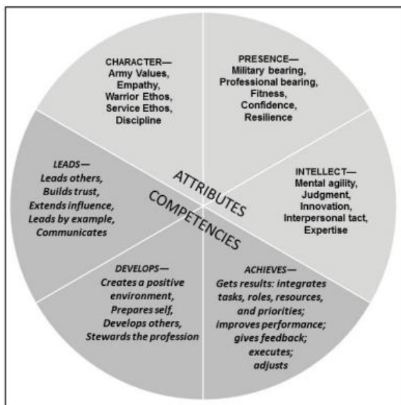
Figure 1-1. Army leadership requirements model

Атрибути - це бажані внутрішні характеристики лідера - те, якими армія вимагає лідерів бути та те, що армія вимагає від них знати. Компетенції – це лідерські навички та поведінка, які можна сформувати та розвинути у процесі професійної підготовки. Армія очікує, що лідери володіють необхідними якостями, постійно їх демонструватимуть і продовжать вдосконалюватися. Єдність компетенцій та атрибутів призводить до довіри між лідером та підлеглими, довіри, яка ґрунтується на організаційному підході та ефективній роботі в команді.