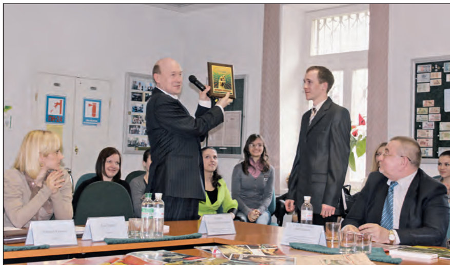
Чергове засідання Дискусійного клубу. За традицією нагородою клубу відзначається основний доповідач.

Одним із найдинамічніших напрямів роботи університету є міжнародна співпраця. Наші досягнення у цій сфері підтверджуються, зокрема, підсумками рейтингу вищих навчальних закладів України “TOP–200”, за результатами якого у 2011–2012 навчальному році УБС НБУ за напрямом міжнародного визнання піднявся з 64 на 31 сходинку, зайнявши гідне місце серед провідних університетів України. Задля досягнення міжнародних стандартів якості освітніх послуг наш уні-