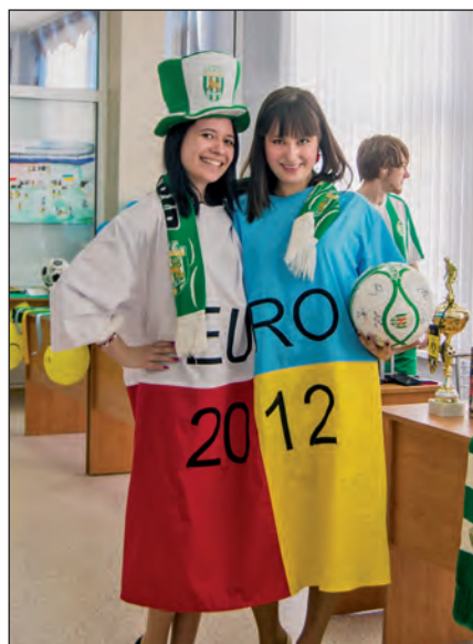
Студенти ЛІБС провели благодійний ярмарок-продаж студентських робіт “Уболіваємо за добро!”, кошти від якого пішли на допомогу дітям Чорнобіля.

Не минули наші фахівці й проблеми погіршення здоров'я молоді в Україні. 2012 рік у нас проходить під гаслом: “Студенти – за здоровий спосіб життя”. Викладачі кафедр фізичного виховання втілили унікальний для української економічної освіти досвід – розпочали поширювати непрофесійну оздоровчу освіту. Наше ноу-хау в тому, що методику викладаємо паралельно з заняттями. Вже сьогодні маємо позитивні зрушення – ранковий біг студентів, що проживають у