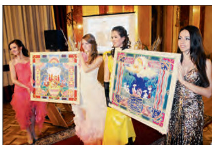
За виручені на VI “Аукціоні надій” гроші у Львові створено перший в Україні Центр реабілітації незрячих.

диться взаємне рецензування наукових і навчальних видань. Ми постійно видаємо актуальну навчальну літературу, 25 книг якої одержало гриф Міністерства освіти, науки, молоді та спорту України, ще 8 очікують такого статусу. Крім цього, кращі науковці вузу друкуються у фахових виданнях: “Вісник Національного банку України”, “Вісник Університету банківської справи НБУ”, “Фінансовий простір” (зараз знаходиться у процесі реєстрації як електронне фахове видання) та збірника наукових праць “Фінансово-кредитна діяльність: проблеми теорії та практики”. Високо оцінили експерти і наше корпора-