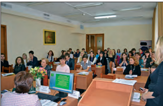
Автори курсу “Фінансова грамотність” провели семінари для вчителів.

асоціації організацій фінансово-економічної освіти (м. Москва, Росія). Наш вуз підтримує співробітництво з 50 іноземними вищими навчальними закладами, банківськими та іншими фінансово-кредитними установами. УБС також активно співпрацює і в межах України, зокрема з різними навчальними закладами та Національним банком. Ми проводимо спільні конференції, семінари, конкурси, обмінюємося досвідом. Також студенти мають змогу активно спілкуватися у літньому таборі, який працює при Севастопольському інституті банківської справи.