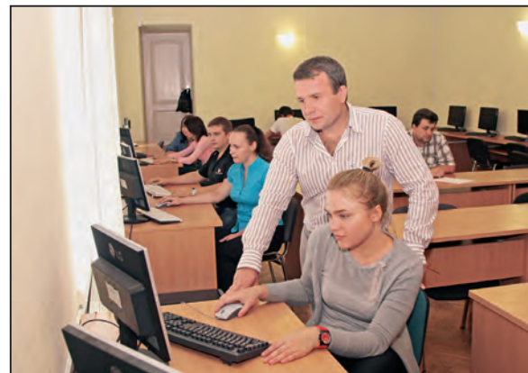
Без глибоких знань комп'ютера не буде професійного банкіра.