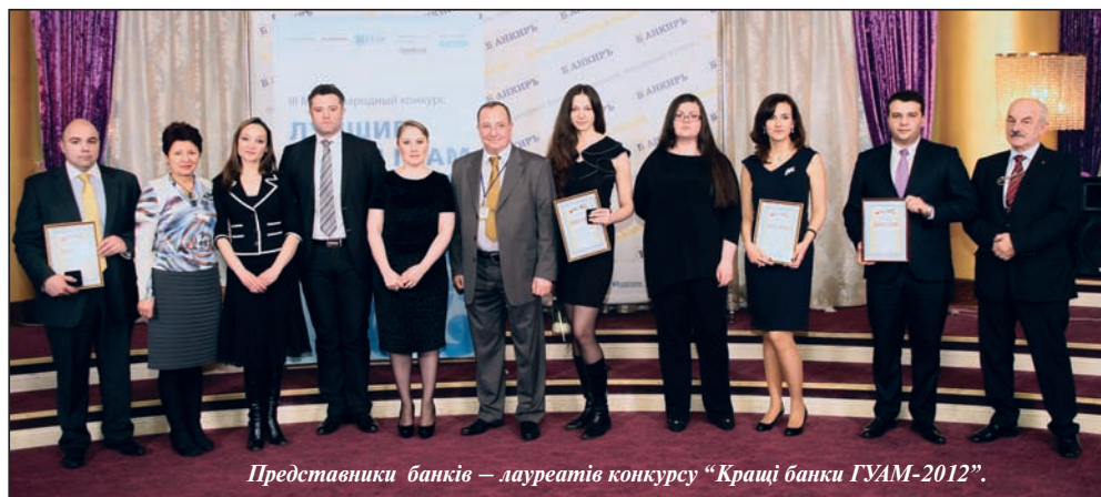
Представники банків – лауреатів конкурсу “Кращі банки ГУАМ-2012”.

М ета конкурсу, який щороку проводять український журнал “Банкир” та Організація