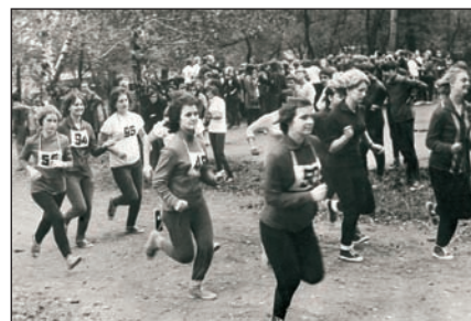
З перших років спортивні змагання були невід'ємною складовою навчально-виховного процесу Черкаського фінансового технікуму.

нього роботодавця. Це дає змогу опанувати необхідні саме у цій сфері знання і навички, на практиці їх закріпити на майбутньому робочому місці