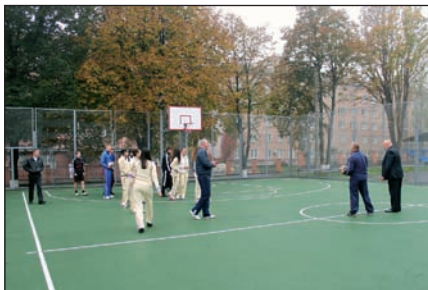
У ЧІБС створено належні умови для занять спортом.

зультати освіти до потреб та вимог ринку праці. Зокрема, Європейська комісія з питань освіти виокремила такі основні компетенції, якими має володіти сучасний європеєць: компетенція у сферах рідної та іноземних мов, математична, фундаментальна природничо-наукова і технічна компетенції, комп'ютерна, навчальна, міжособистісна, міжкультурна, соціальна, громадянська, а також підприємницька і культурна компетенції. Вони забезпечуються такими здібностями, як критичне мислення, креативність, "європейський вимір" і активна життєва позиція. У комплексі ці характеристики сприяють гармонійному розвитку особистості.