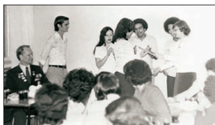
Студенти з Куби навчалися у Черкаському фінансовому технікумі в 1980–1988 рр.

Під час науково-практичного симпозиуму начальник центру інформаційних технологій УБС НБУ Петро Гармидаров презентував дворівневу навчально-тренувальну банківську систему університету, що максимально наближена до реалій роботи працівників фінансових установ у дворівневій банківській системі України. Це інноваційна розробка УБС НБУ, яка функціонуватиме на основі навчально-тренувальних банків, що є у кожному з інститутів університету. Зокрема, складовими цієї системи, що за структурою