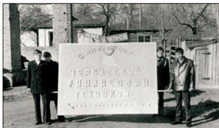
Перші студенти Черкаського фінансового технікуму, 7 листопада 1968 р.

та налагодити взаємодію з колегами по роботі. При цьому, якщо замовники виявляють певні недоліки в підготовці випускників і повідомляють про це, навчальний заклад негайно вдосконалює програму. Еріх Келлер також наголосив, що структурна схема дуального навчального процесу є простою і зрозумілою для всіх його учасників, вона передбачає постійну взаємодію студентів із наставниками, котрі не є штатними співробітниками університету, — їх залучають на платній основі з профільних установ та організацій для практичної роботи з майбутніми випускниками. Таким чином у навчальному процесі безпосередньо задіяні представники державних органів, які мають значний практичний досвід роботи і можуть передати його студентам. При потребі студенти німецьких вузів також проходять стажування за кордоном.