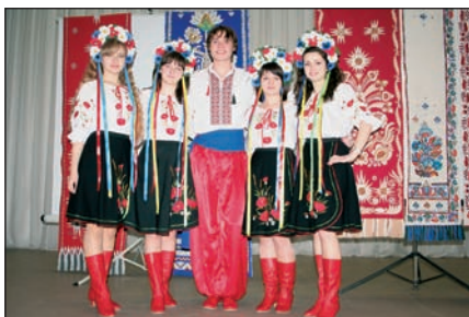
Студенти ЧІБС щороку беруть активну участь у святі української вишиванки.

З метою задоволення вимог ринку праці щодо врахування фахових вимог до випускників УБС НБУ на замовлення департаменту персоналу НБУ було виконано науково-дослідну роботу на тему "Визначення первинних посад та розробка кваліфікаційних характеристик, заснованих на компетенціях, фахівців банківської сфери". В результаті проведених досліджень встановлено, що глобалізаційні процеси у світі, інтенсивний перерозподіл фінансових та людських ресурсів, злиття компаній з метою оптимізації інтересів капіталу деяких країн набувають розвитку. Очевидним є те, що до цих перетворень залучаються й адекватні зміни у працевлаштуванні та професійно-кваліфікаційній сфері як у цілому