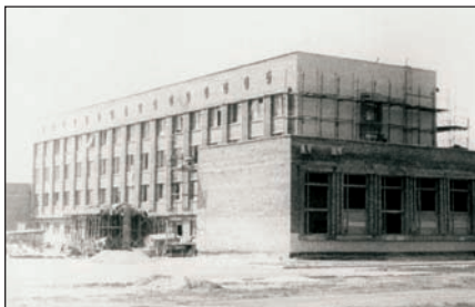
Будівництво головного корпусу Черкаського фінансового технікуму (початок 1970-х років).

У дослідженнях і заходах інституту беруть активну участь студенти. Під керівництвом науково-педагогічних працівників вони є учасниками міжнародних та всеукраїнських наукових конференцій, семінарів, круглих столів, ярмарків тощо.