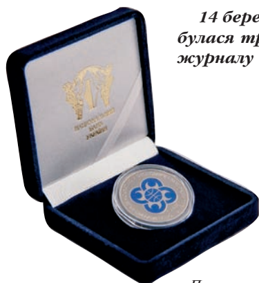
Приз конкурсу “Кращі банки ГУАМ-2012”.

14 березня 2013 року в Триумфальній залі столичного готельного комплексу “Київ” відбулася традиційна церемонія нагородження представників кращих банків за версією журналу “Банкир” та Організації за демократію та економічний розвиток ГУАМ.