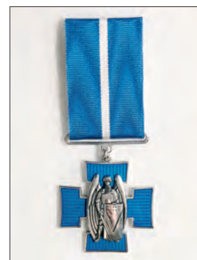
Одна з найновіших державних нагород – орден Героїв Небесної Сотні.