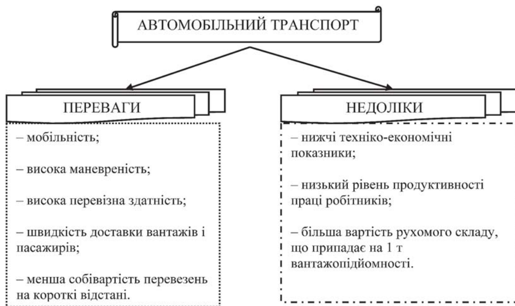
Рис. 1. Переваги і недоліки автомобільного транспорту у порівнянні з водним і залізничним

— великі витрати автомобільна галузь несе через високі вартості палива і великі потужності двигунів (на одиницю рухомого складу) [5].