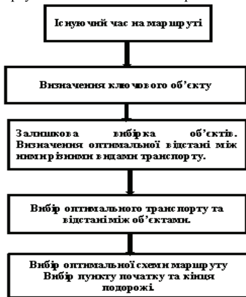
Рисунок 3. – Схема формування туристичного маршруту

Дослідження мінімальні відстані між вибраними об'єктами, тобто всі шляхи під'їздів до об'єктів різними видами транспорту схематично показан на рис 3.