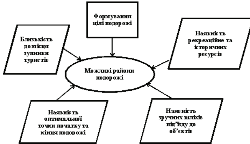
Рисунок 2. – Фактори впливу на вибір району подорожі

бір зручних, не утомливих для руху пішки, лісових або польових доріг і стежок, паркових алей. Ще найголовнішим обмеженням при формуванні екскурсійна – пізнавального маршруту – це час перебування на маршруті і на об'єктах мінімальна відстань між ними та потенційні матеріальні (фінансові) витрати туристів. Критерії вибору району походу диктуються, в тому числі, мотивами, побажаннями, устремліннями туристів (суб'єктивним фактором). Отже, їх може бути набагато більше, чим вище згаданих. Тобто графічно можна показати вибір району на рис 2