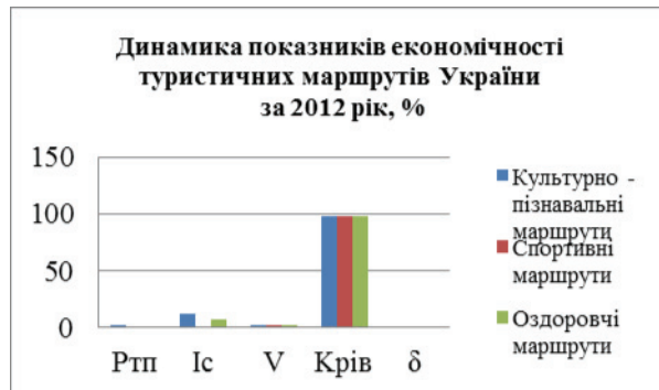
Рисунок 1. – Аналіз економічності туристичних маршрутів України

З рисунку видно, що на сьогоднішній день саме культурно-пізнавальні (екскурсійна – пізнавальні) маршрути несуть в собі більший дохід держави. Тому для перспективного розвитку туризму в Україні треба розвивати екскурсійні маршрути.