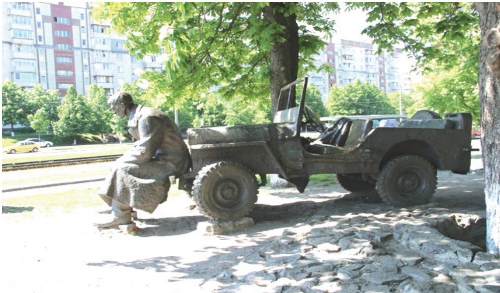
Пам'ятник джипу «Вілліс»

Як відомо віллісі, студебекери та інші автомобілі американського виробництва постачались в Радянський Союз в роки Другої світової війни Сполученими Штатами Америки по системі ленд-лізу і відігравали значну роль в перемозі над фашизмом.