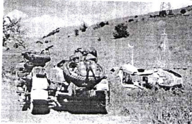
Пам'ятник загиблому мотоциклісту, Таджикистан

В Києві на Харківському житловому масиві на постаменті стоїть легкий броньований автомобіль камуфляжного кольору з кулеметом. Ніяких надписів нема, але мешканці району покладають вінки і квіти як пам'ять про війну в Афганістані. В лютому наступного року минає вже двадцять чотири роки після виведення радянських військ з Афганістану. Дуже велику роль відіграли в тій неоголошеній війні військові водії та солдати-автодорожники. У Харкові в 2003 році у видавництві «Контраст» побачила світ книга-фотоальманах учасника бойових дій в Афганістані, журналіста С. Буковського з промовистою назвою «Обеліски». Ось дослівно цитата із неї (зі скороченнями): «Как все-таки красивы афганские дороги. Горное ущелье, внизу бежит речка. Вдоль речки вьется лента автомобильной дороги. Похоже на Крым. Только авто дор на обочине, установленные _вто дор воинам, предупреждают, как авто доро эта красота... Обелиски – авто до постаменты на афганской земле... Вот руль и колесо — погиб автодор. Вот бензопроводные трубы — погиб «трубач...» Розглядаючи фотографії книги «Обеліски», можна з упевненістю визначити рід військ загиблих воїнів. Ось стоїть на узбіччі велика кам'яна брила, з якої із крана летиться вода, а на камені викарбувано «Мельцин Сергей 1965-85». Але під прізвищем висічена бортова вантажівка марки «ЗІЛ». Ще один пам'ятник. На постаменті якого надпис: «воїнам-дорожникам і встановлений чотиривісний трудяга-автомобіль БМП з бортовим номером 787.