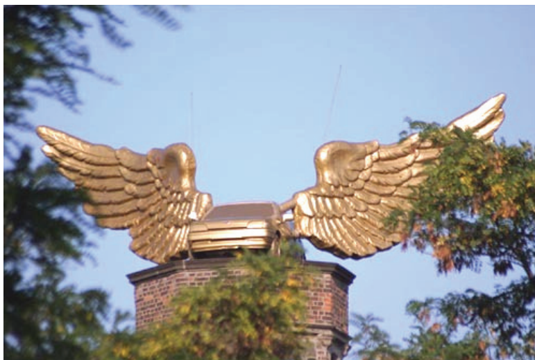
Золотокрилий Ford Fiesta м. Кельн, що має офіційну назву «Золотий птах»

В західнонімецькому місті Кельн у 1991 році з'явився оригінальний пам'ятник-автомобіль. Виготовив його концептуальний скульптор Ха Шульц із кузова серійного автомобіля «Форд», прикріпивши до нього два крила з позолотою, кожне вагою 800 кг. Золотокрилий Ford Fiesta за угодою з місцевою владою був встановлений на спеціальний п'єдестал на даху міського музею в м. Кельн. Він дуже сподобався мешканцям міста і туристам, отримавши офіційну назву «Золотий птах». В березні 2005 року він був знятий на реставрацію і після кількох тижнів ремонтних робіт за допомогою гелікоптера був встановлений на своє попереднє звичайне місце на п'єдестал на даху міського музею на втіху туристам.