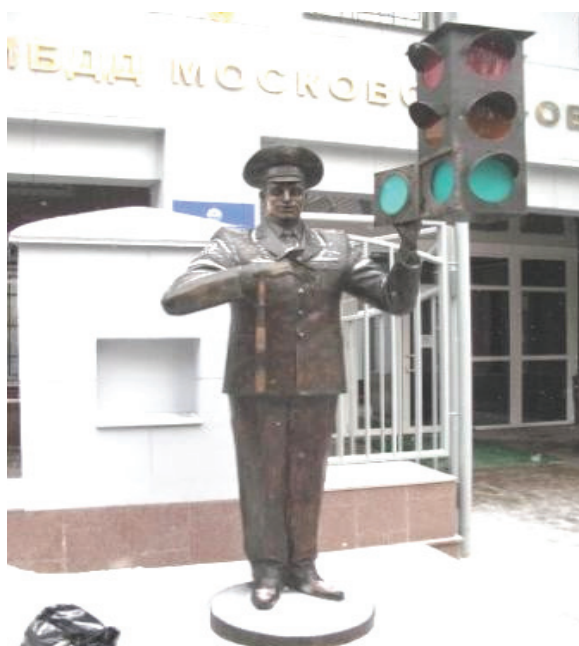
«Дядя Стьопа» в Москві

В далекі вже радянські часи в народі дуже популярним став створений поетом Сергієм Михалковим постовий міліціонер двометровий «Дядя Стьопа». Слід об'єктивно визнати, що на цих віршах в повазі до правил дорожнього руху виховувалось багато поколінь юних громадян Радянського Союзу. Як визнання заслуг в пропаганді безпечного поведження на вулицях та автодорогах тепер у Москві в Слюсарному провулку споруджено чотириметровий пам'ятник цьому літературному герою-міліціонеру.