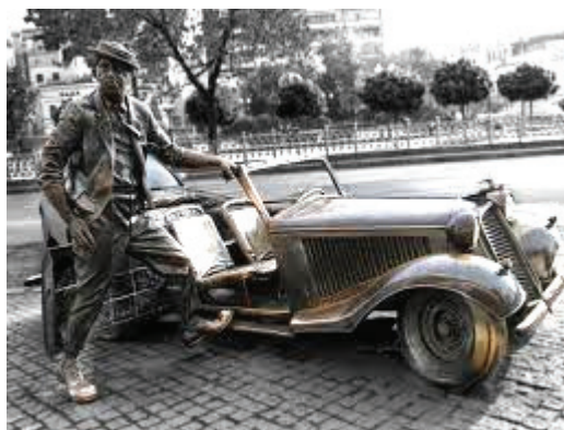
Пам'ятник Юрію Нікуліну в Москві

В Одесі багато приїжджих громадян прагнуть побувати в саду скульптур літературного музею. Тут, зокрема, можна побачити пам'ятник легендарному автомобілю «Антилопа-Гну», описаному в романі Ільфа і Петрова «Золоте теля». Перед вами золотом горить автомобіль-розвалюха, в якому розмістився безсмертний екіпаж пройдисвітів. За кермом сидить автомеханік Адам Козлевич, а тримаючись за його плече стоїть на сидінні син турецько підданого Остап Бендер. Шура Балаганов через борт допомагає залізити в автомобіль на ходу Михайлу Паніковському з вкраденим гусаком під рукою. Так відображена автогонка «синів лейтенанта Шмідта» за чужими грошима. В Москві біля цирку на Цвітному бульварі споруджено пам'ятник славнозвісному коміку, народному артисту СРСР Юрію Нікуліну. Він стоїть поряд з автомобілем, що нагадує той, на якому роз'їжджала відома кінотрійця Бувалій (Ю. Моргунов), Трус (Г. Віцин) і Балбес (Ю. Нікулін) в кінокомедіях кінорежисера Гайдая «Операція И», та «Кавказька полонянка».