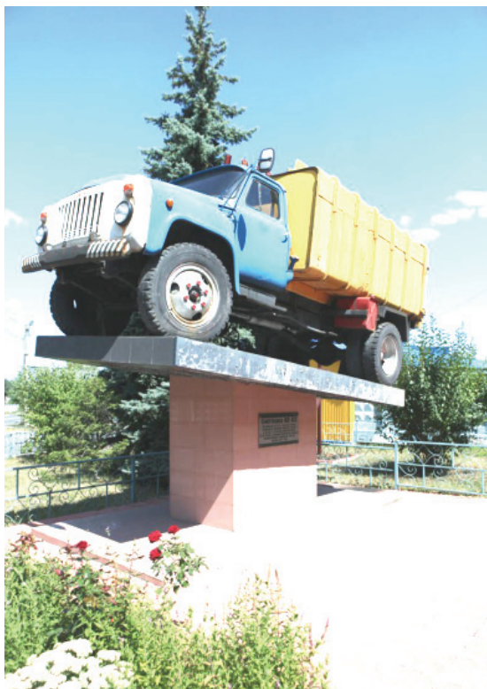
Пам'ятник до 35-річчя заснування об'єднання «Київспецтранс»

В Києві в середині 2004 року біля головного офісу правління «Київспецтранс» по проспекту Правди, 85, з'явився оригінальний пам'ятник. На постамент було встановлено старий ГАЗ-53, обладнаний контейнером, відомий як смітєвоз. Для цього віднайшли старенький смітєвоз КО-413, _ід реставрували та відремонтували його, пофарбували кабінку водія та контейнер в жовтий колір і встановили на високий постамент. Ось таким чином було відзначено 35-річчя заснування об'єднання «Київспецтранс» та 10-річчя створення Української асоціації автопідприємств санітарної очистки.