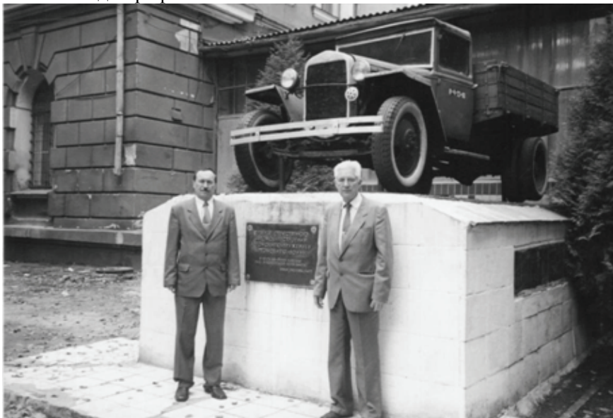
Харківський автотранспортний технікум