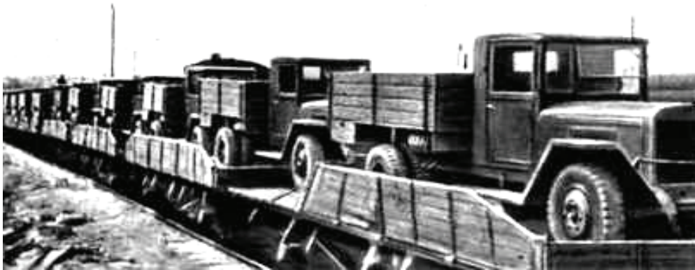
Потяг з автомашинами прямує на фронт