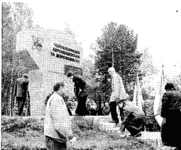
Пам'ятний знак автомобілістам і дорожникам – учасникам ліквідації наслідків аварії на Чорнобильській АЕС

Велика трагедія – аварія в 1986 році на Чорнобильській атомній електростанції потребувала участі представників різних професій — пожежників, будівельників, шахтарів, військових, енергетиків. Досить значну роль відіграв автомобільний транспорт. Згадаймо, що вже на другий день після аварії 27 квітня для евакуації населення м. Прип'ять були задіяні 1225 автобусів та 360 вантажних автомобілів, а також із залізничної станції Янів-два дизель-поїзда місткістю 1500 пасажирів. Левова частка обсягів перевезень різноманітних вантажів для будівництва об'єкту «Укриття», що разом з підготовкою тривала 206 днів і ночей, виконана була автомобільним транспортом. Минає 27 років від дня аварії на ЧАЕС. За цей період багато споруджено пам'ятників, ліквідаторам різних професій. Представники багатотисячної армії автомобілістів і автодорожників щороку прибувають до обеліска, який встановлено до 15-ї річниці аварії на ЧАЕС на 20-му кілометрі автомагістралі Київ–Овруч.