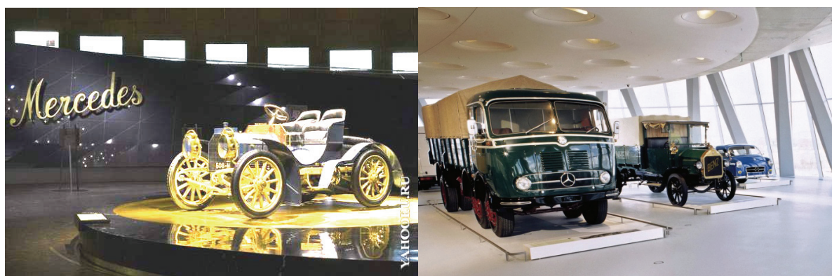
Музей історії Mercedes-Benz у Штутгарті

Колекціонування – це не тільки механічне збирання визначених речей та фактів, але ще дослідження та вивчення предмету свого хобі. Відомо, що в минулому єгипетський король Фарук збирав автомобілі «Роллс-ройс» тільки червоного кольору, автомобільний магнат Генрі Форд-молодший пляшки з-під джина. Колекції своїх автомобілів мають всесвітньо відомі фірми «Форд», «Мерседес», «Фіат», «Вольво» та інші.