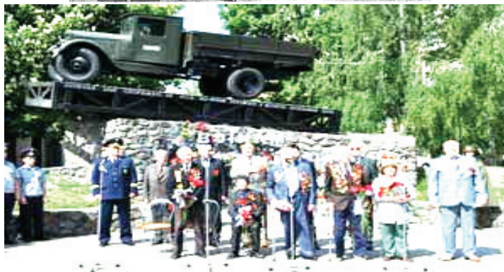
Пам'ятник «Воїнам-автомобілістам і дорожникам», Київ

Встановлено пам'ятник полуторці і біля Ладозького озера в Росії. «Дорога життя» – це була воєнно-стратегічна магістраль, що проходила через Ладозьке озеро під час 900-денної блокади Ленінграда в період з вересня 1941 року по березень 1943 року і зв'язувала його з тилом країни. В теплий період відбувалась навігація по воді, а взимку по льоду автотранспортом. Всього по «дорозі життя» в Ленінград було перевезено за той час 1635 тисяч тонн вантажів і евакуйовано на Велику землю близько 1376 тисяч чоловік ленінградців.