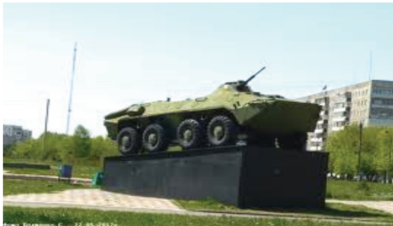
Афганістан, 1987 р.

В Києві на Харківському житловому масиві на постаменті стоїть легкий броньований автомобіль камуфляжного кольору з кулеметом. Ніяких надписів нема, але мешканці району покладають вінки і квіти як пам'ять про війну в Афганістані. В лютому наступного року минає вже двадцять чотири роки після виведення радянських військ з Афганістану. Дуже велику роль відіграли в тій неоголошеній війні військові водії та солдати-автодорожники. У Харкові в 2003 році у видавництві «Контраст» побачила світ книга-фотоальманах учасника бойових дій в Афганістані, журналіста С. Буковського з промовистою назвою «Обеліски». Ось дослівно цитата із неї (зі скороченнями): «Как все-таки красивы афганские дороги. Горное ущелье, внизу бежит речка. Вдоль речки вьется лента автомобильной дороги. Похоже на Крым. Только авто дор на обочине, установленные _вто дор воинам, предупреждают, как авто доро эта красота... Обелиски – авто до постаменты на афганской земле... Вот руль и колесо — погиб автодор. Вот бензопроводные трубы — погиб «трубач...» Розглядаючи фотографії книги «Обеліски», можна з упевненістю визначити рід військ загиблих воїнів. Ось стоїть на узбіччі велика кам'яна брила, з якої із крана летиться вода, а на камені викарбувано «Мельцин Сергей 1965-85». Але під прізвищем висічена бортова вантажівка марки «ЗІЛ». Ще один пам'ятник. На постаменті якого надпис: «воїнам-дорожникам і встановлений чотиривісний трудяга-автомобіль БМП з бортовим номером 787.