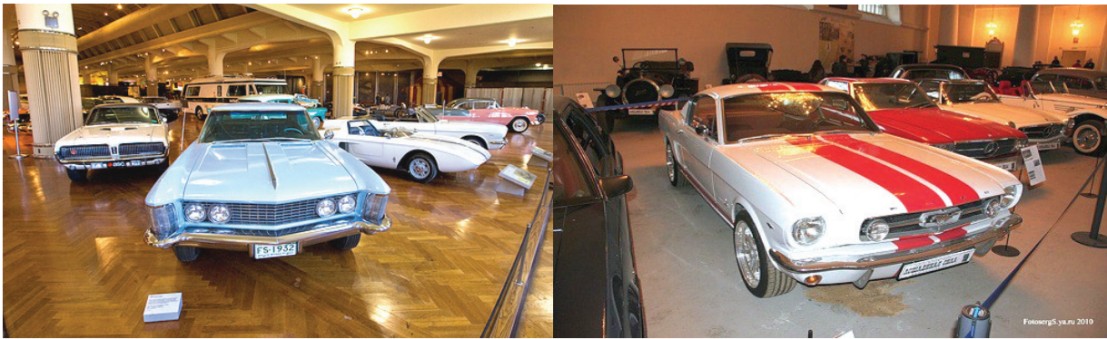
Музей «Форда» у Детройті

Московський автомобільний завод під час наступу фашистів на Москву був евакуйований в Ульяновськ. Нагадаймо, що рішення про евакуацію московських підприємств було прийняте 14 жовтня 1941 року. Згодом на його базі з'явився Ульяновський автозавод, який зокрема випускав знамениті УАЗи, один з них як пам'ятник знаходиться на підприємстві. А в Луцьку ще можна побачити популярний пасажирський всюдихід ЛУАЗ, про який в радянські часи була широко поширена байка з запитанням польського туриста: «Що пан сам скльопає?». В музеї московського автозаводу імені Ліхачова зберігається історичний екземпляр автомобіля «АМО», оспіваний в колись популярній бардовській пісні про шофера Колю Снігирьова, який їздив на трьохтонному «АМО» по Чуйському тракту на Алтаї. Ще можна побачити і мотоцикл з коляскою, піднятий на 3,5 м на металевих палях перед Київським мотоциклетним заводом, що їх виробляв.