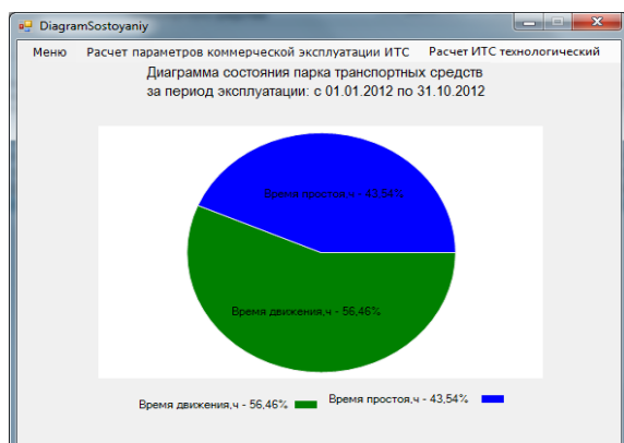
Рисунок 2. – Діаграма стану парку ТЗ за певний період експлуатації

На основі отриманих параметрів будується діаграма стану парку ТЗ за певний період експлуатації (рис. 2).