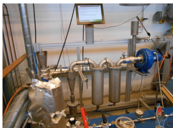
Рисунок 2. – Газогенераторна установка