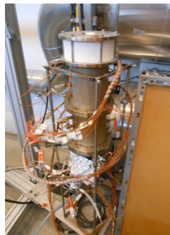
Рисунок 4. – Калориметр

Реактор установки складається із п'яти циліндричних секцій Ø 150 мм. Реакційна зона звужена до Ø 90 мм. Рух газів через газогенератор здійснюється за допомогою відцентрового вентилятора з регульованою частотою обертання (рисунок 5). Повітря надходить у реактор через три сопла. Кількість повітря, що надходить, його температура та тиск фіксуються витратоміром повітря.