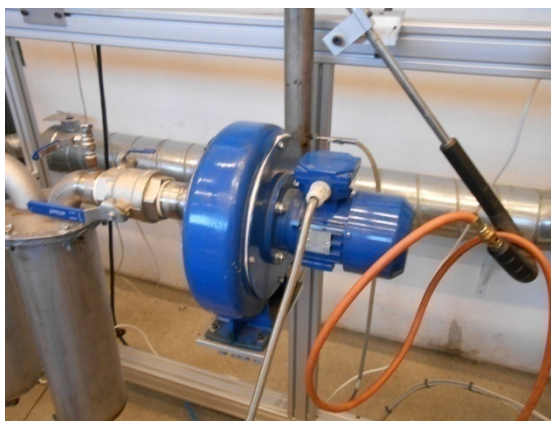
Рисунок 5. – Відцентровий вентилятор

Сопла для повітря розташовані на одному рівні по висоті та рівномірно по колу через 120°. Горіння починається на рівні надходження повітря. Продукти горіння пропускаються через реакційну зону, де проходить реакція газифікації. Реактор покритий ізоляцією з високою стійкістю (Isofrac), щоб підтримувати потрібну температуру всередині його (див. рис. 1). Температури в реакторі вимірюються термопарами, придатними до короткочасного використання у температурному діапазоні від -270^{\circ}\text{C} до +1300^{\circ}\text{C} . Чотири термопари, розміщені безпосередньо над та під реакційною зоною (T2, T3, T4, T5), призначені для вимірювання температури біомаси в процесі газифікації, інші три (T1, T6, T7) – для вимірювання температури стін реактора (див. рис. 1).