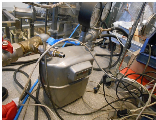
Рисунок 3. – Витратомір повітря