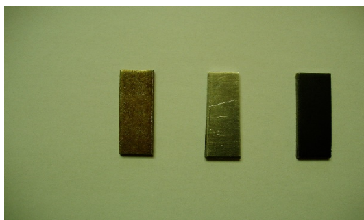
Рисунок 1. — Вплив штатного дизельного палива на досліджувані зразки матеріалів

Досліджувані зразки металів витримувалися у ємностях протягом двох місяців за температури 20°C. Результати впливу корозійного середовища палив на металеві пластини наведені на рис. 1—3 (зліва направо — пластини відповідно з вуглецевої сталі Ст3, оцинкованої вуглецевої сталі СтЗ і алюмінієвого сплаву АМГ5М).