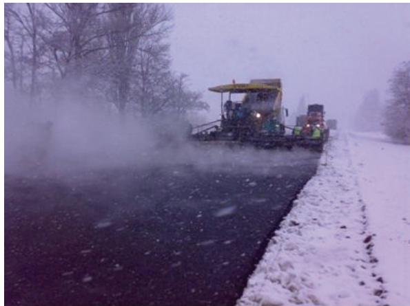
Рисунок 1 – Влаштування асфальтобетонних шарів при мінусових температурах повітря

Досліджували температурні режими асфальтобетонної суміші під час транспортування та кінетику її остигання в процесі укладання та ущільнення. Здійснювали науковий супровід капітального ремонту автомобільної дороги М-01 Київ – Москва на ділянці Кіпті – Глухів – Бачівськ. При цьому дальність возки в окремих випадках складала близько 100 км. Мінімальна температура повітря при виконанні робіт була мінус 3 – мінус 7^{\circ}\text{C} (Рисунок 1).