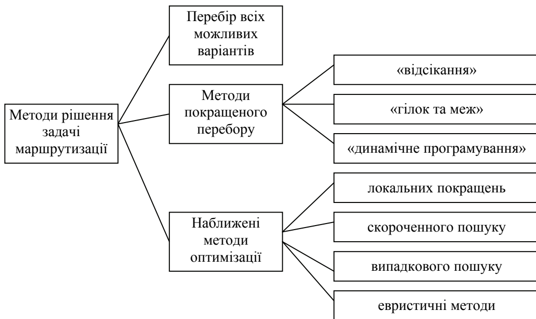
Рисунок 1 – Класифікація методів маршрутизації вантажних перевезень

На основі аналізу методів рішення задачі маршрутизації [6] запропоноване групування, що наведене на рис. 1.