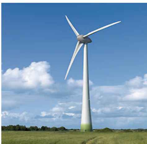
Рисунок 1 — Вітрогенератор [1]

У конструкції сучасних вітрових електростанцій закладені новітні наукові і експериментальні розробки використання кінетичної енергії вітру, що дозволили добитися високої ефективності, надійності експлуатації і низької вартості електроенергії, що виробляється.