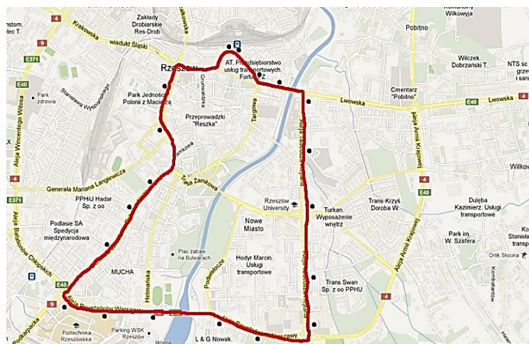
Rys. 2. Mapa jazdy linii autobusowej 0A (czerwona linia) wraz z siecią przystanków (czarne kropki) [4]

Linia 0A liczy 19 przystanków. Badania przeprowadzone zostały z przystanku dziesiątego, ukazanego wcześniej na rys. 1.