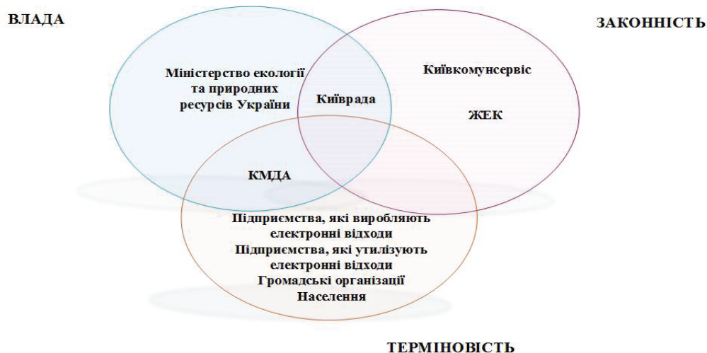
Рис. 3 – Модель Мітчелла встановлення значимості учасників: розподіл учасників за значимістю

Три з них виділяють одним атрибутом (латентні), три – двома (очікувальні), і один – трьома (ключовий). До латентних відноситься спляча група (володіє владою), до якої віднесено Міністерство екології та природних ресурсів України; контрольована (володіє законністю), що включає ЖЕК та Київкомунсервіс; та вимагаюча (що володіє терміновістю), утворена підприємствами, які виробляють та утилізують електронні відходи, громадськими організаціями та населенням. У результаті поєднання властивостей виділяють сім класів значимості стейкхолдерів (рис. 3).