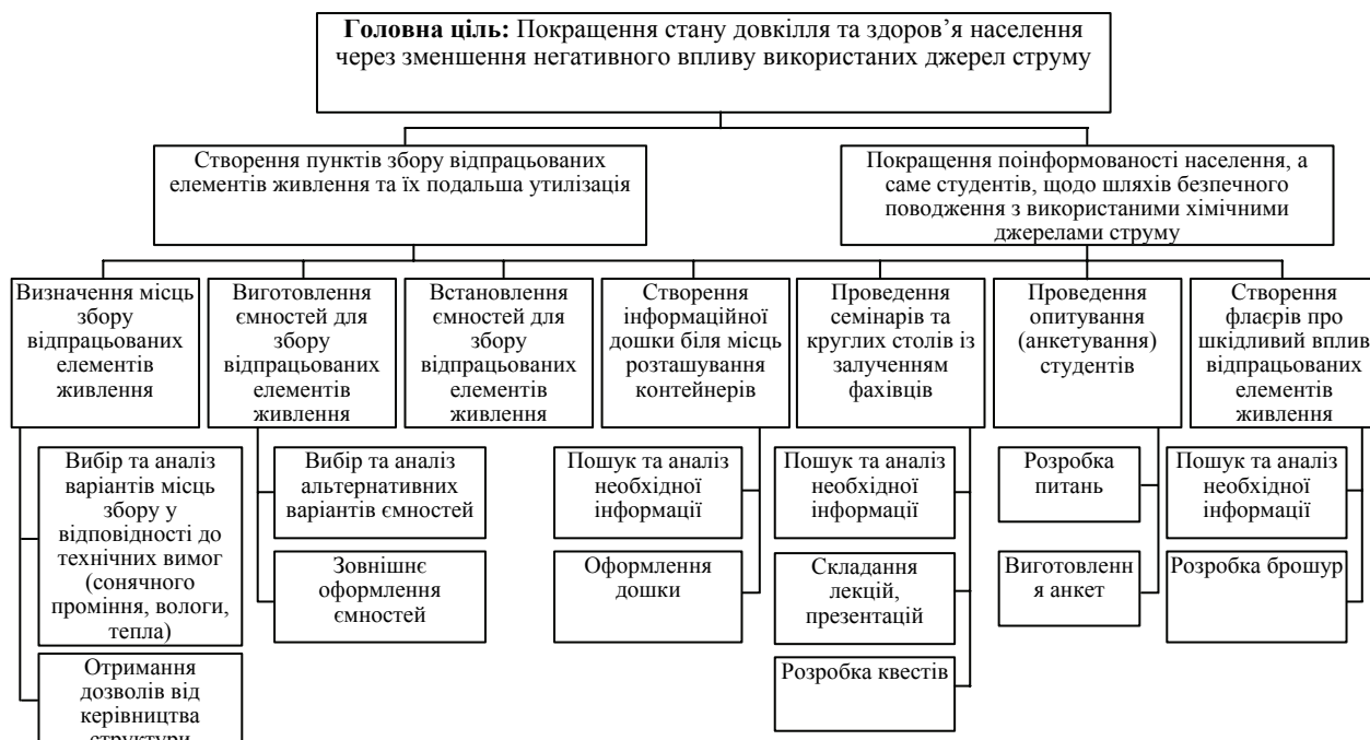
Рис. 2 – Стратегічне дерево цілей