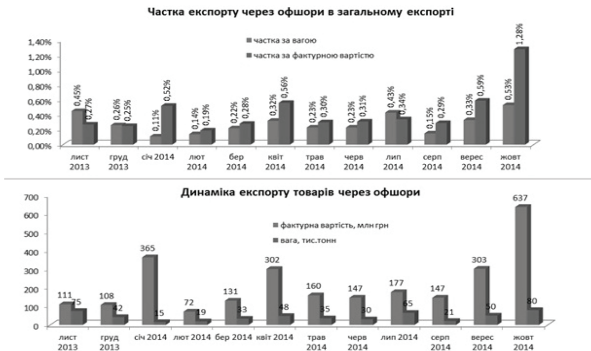
Рисунок 2 – Експорт через офшори та його динаміка

січні місяці було найбільше співвідношення між часткою за фактурною вартістю та вагою експортованих товарів, що може свідчити збільшення зусиль з виводу коштів (Рис. 2).