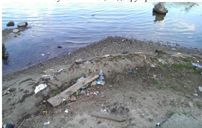
Рисунок 2 - Місце відбору проби

Таблиця 1 - ПАСПОРТ ПРОБИ [6]. Дослідження якості води у поверхневих джерелах централізованого водопостачання