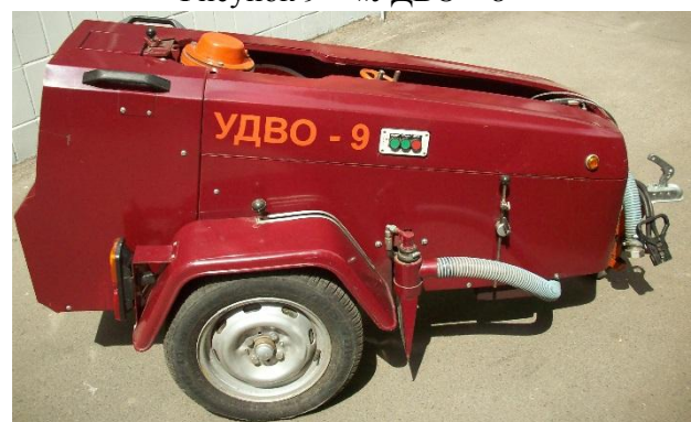
Рисунок 11 – «УДВО – 9»

«УДВО – 5Д» разработано совместно с ГНТЦ «Доркачество».