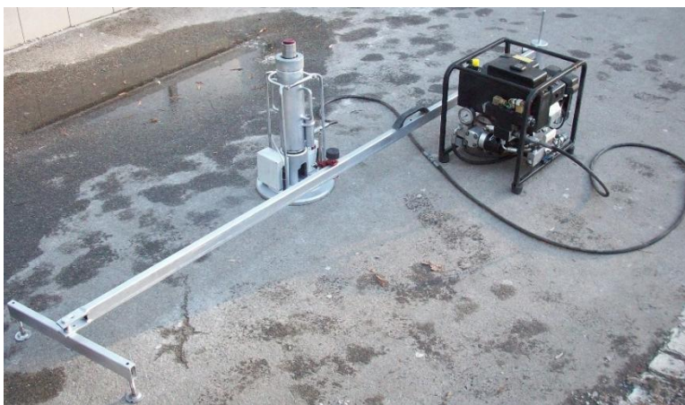
Рисунок 18 – Станция для штамповых испытаний дорожных конструкций и их слоев

Основным отличием станции от известных зарубежных аналогов является то, что на штампе смонтирован лазерный датчик перемещения, который регистрирует соответствующие параметры и передает их с помощью устройств передачи результатов измерений по радиоканалу BlueTooth на персональный компьютер. Управление насосной станцией осуществляется при помощи пульта дистанционного управления (рис. 19).