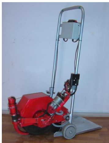
Рисунок 23– Портативный прибор НТУ для измерения коэффициента сцепления автомобильных дорог и тротуаров

Портативный прибор НТУ для измерения коэффициента сцепления автомобильных дорог и тротуаров (рис. 23).