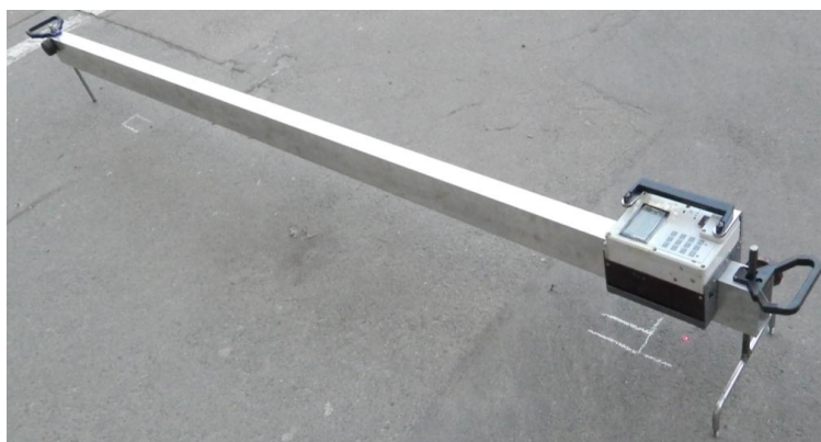
Рисунок 20– Прибор «Колеемер-НТУ»

Прибор «Колеемер-НТУ» предназначен для сканирования поверхности дорожного покрытия в поперечном или продольном направлении (рис. 20) [14].