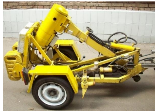
Рисунок 7 – «УДВО – 6»