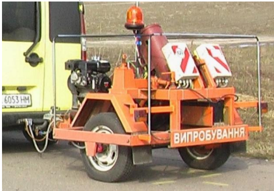
Рисунок 6 – «УДВО – 5Д»