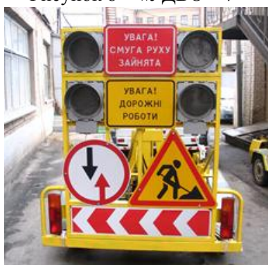
Рисунок 10 – «УДВО – 8»