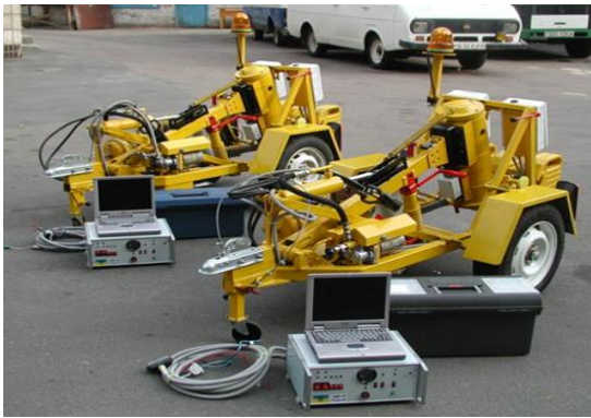
Рисунок 4 – «УДВО – 3,4»