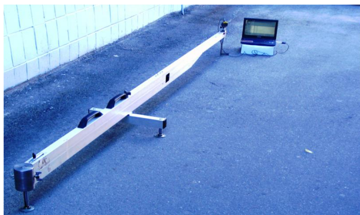
Рисунок 15 – Электронный прогибомер НТУ

предназначен для измерения и записи прогибов дорожных одежд и грунтовых оснований при штамповых испытаниях с минимальным температурным воздействием солнечного нагрева.