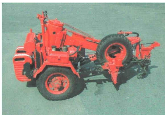
Рисунок 2 – «УДВО – 1»

Универсальное дорожное измерительное оборудование «УДВО» (рис.2–11) включает смонтированные на одноосном прицепе и объединенные в единый комплекс узлы измерения прочности, ровности и коэффициента сцепления, расстояния и скорости движения. К месту измерений прицеп транспортируется в салоне передвижной лаборатории (рис. 3) [4].