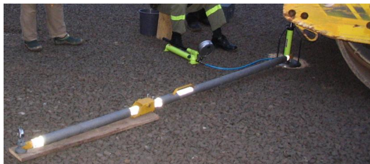
Рисунок 13 – Комплект приспособлений для штамповых испытаний дорожных конструкций