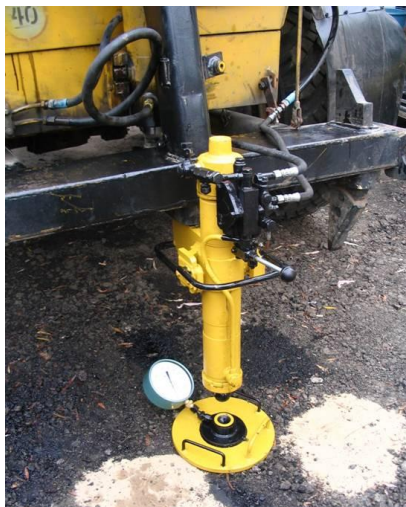
Рисунок 14 – Навесное оборудование НТУ на автогрейдер

предназначено для создания расчетной нагрузки при штамповых испытаниях слоев дорожной одежды и грунтовых оснований.