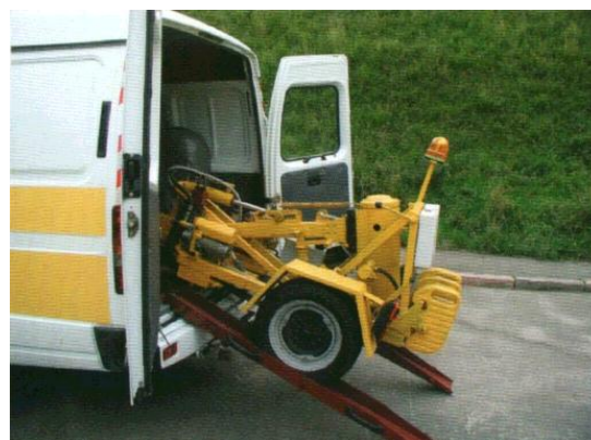
Рисунок 3 – «УДВО – 2»