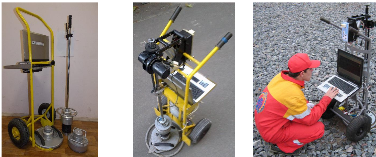
Рисунок 16 – Приборы «ПВНЗ-1-НТУ»

Каждый из приборов состоит из горизонтальной штанги, по которой скользит гири массой 10 кг, падающая на штамп с заданной высоты. В штампе установлен датчик ускорения, который подсоединен к системе считывания и обработки сигнала. С помощью программного обеспечения данного прибора обрабатывается сигнал с датчика и получают перемещение штампа, а также несущую способность основания. Отличие от известных приборов такого типа состоит в том, что подъем и опускание гири осуществляется автоматически. Прибор также позволяет определять зависимость модуля деформации от количества ударов, по которой, как асимптотическое значение, можно определить максимальную несущую способность грунта, которую можно достичь при уплотнении, и принимать решение о целесообразности работы уплотняющей техники на участке строительства. Метрологическая аттестация прибора производится согласно ПМА 033/01-08-2010 [10]. Целью ее является сопоставление заданных параметров колебаний платформы вибростенда 4809, на которую устанавливается датчик прибора, со значениями виброускорения, виброскорости и виброперемещения, которые показывает измерительная система «ПВНЗ-1-НТУ» (рис. 17).