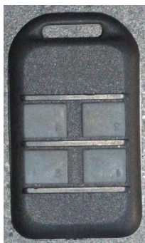
Рисунок 19 – Пульт дистанционного управления

Основным отличием станции от известных зарубежных аналогов является то, что на штампе смонтирован лазерный датчик перемещения, который регистрирует соответствующие параметры и передает их с помощью устройств передачи результатов измерений по радиоканалу BlueTooth на персональный компьютер. Управление насосной станцией осуществляется при помощи пульта дистанционного управления (рис. 19).