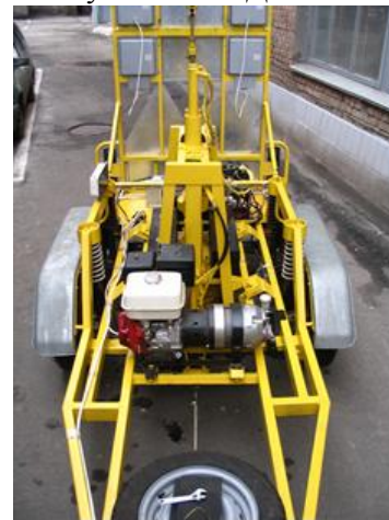
Рисунок 9 – «УДВО – 8»