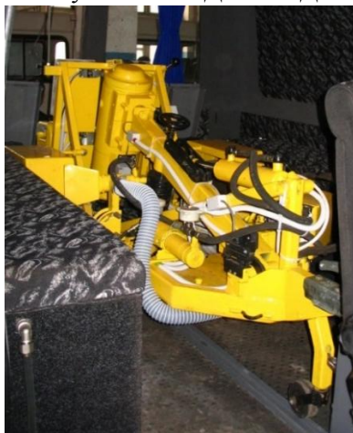
Рисунок 8 – «УДВО – 7»