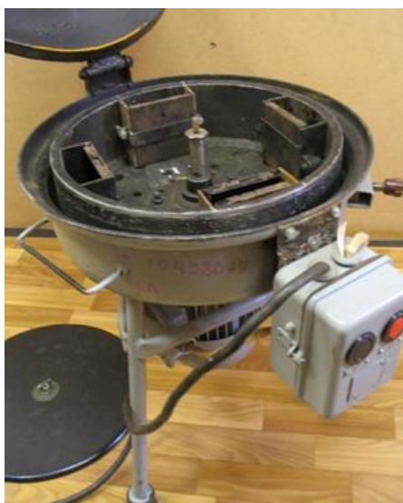
Рисунок 1 – Устройство «ЦП-НТУ»

Устройство «ЦП-НТУ» («Центробежное устройство НТУ») предназначено для оценки приживаемости каменного материала к дорожному покрытию при устройстве тонких слоев износа и поверхностных обработок. Устройство являет собой горизонтальную центрифугу, ротор которой вращается с заданной частотой (рис.1).