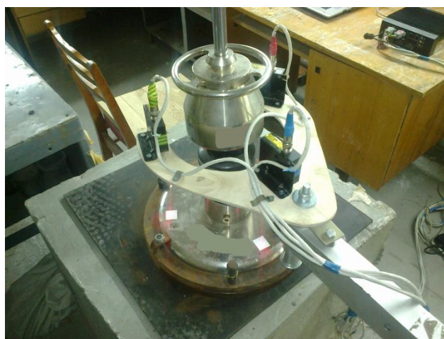
Рисунок 17 – Стенд для проведения метрологической аттестации

Каждый из приборов состоит из горизонтальной штанги, по которой скользит гири массой 10 кг, падающая на штамп с заданной высоты. В штампе установлен датчик ускорения, который подсоединен к системе считывания и обработки сигнала. С помощью программного обеспечения данного прибора обрабатывается сигнал с датчика и получают перемещение штампа, а также несущую способность основания. Отличие от известных приборов такого типа состоит в том, что подъем и опускание гири осуществляется автоматически. Прибор также позволяет определять зависимость модуля деформации от количества ударов, по которой, как асимптотическое значение, можно определить максимальную несущую способность грунта, которую можно достичь при уплотнении, и принимать решение о целесообразности работы уплотняющей техники на участке строительства. Метрологическая аттестация прибора производится согласно ПМА 033/01-08-2010 [10]. Целью ее является сопоставление заданных параметров колебаний платформы вибростенда 4809, на которую устанавливается датчик прибора, со значениями виброускорения, виброскорости и виброперемещения, которые показывает измерительная система «ПВНЗ-1-НТУ» (рис. 17).