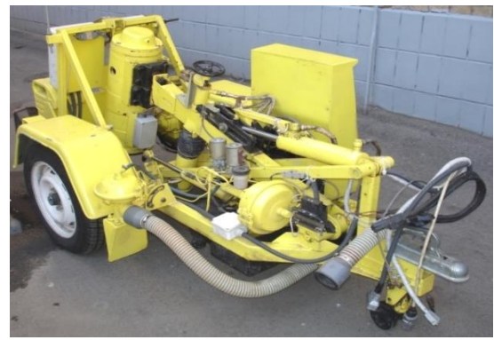
Рисунок 5 – «УДВО – 5»