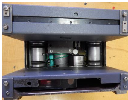
Рисунок 21 – Измерительная каретка с датчиками

Прибор состоит из балки на двух опорах и измерительной каретки с набором необходимых датчиков. Основным рабочим элементом прибора является лазерный датчик, установленный в измерительной каретке прибора (рис. 21).