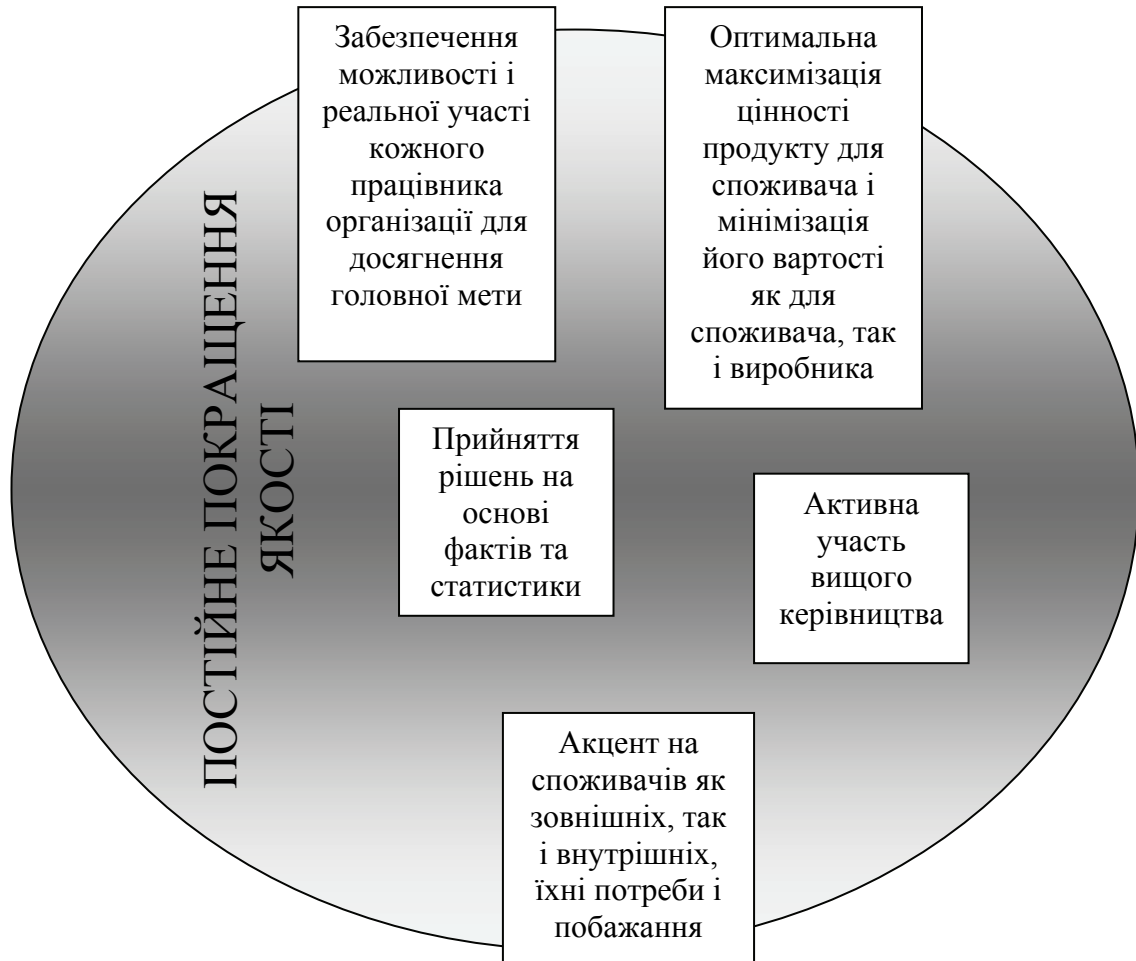
Рисунок 2 – Узагальнююча схема найважливіших елементів TQM.

Так, до планування вдосконалення можна віднести вивчення потреб споживача, суспільства, співробітників і організації в цілому, внутрішніх резервів організації і калькуляції майбутніх витрат. До реалізації вдосконалення – визначення пріоритетів серед процесів, що підлягають коригувальним впливам, створення команди по удосконалюванню процесу та уточнення задач. А критеріями оцінки можуть бути національні та міжнародні премії якості, внутрішні бальні системи тощо.