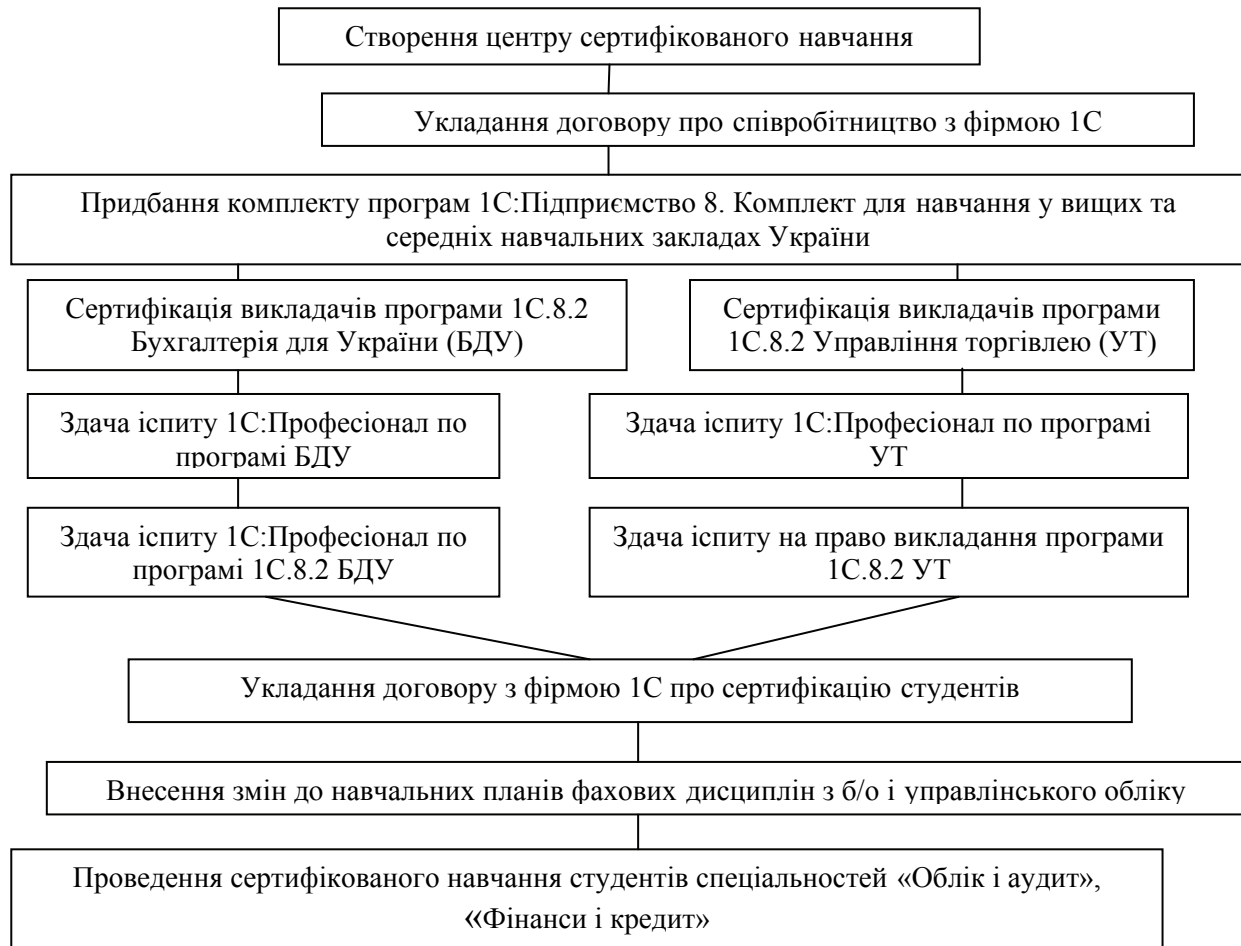
Рисунок 2 – Етапи створення ЦСН в НТУ