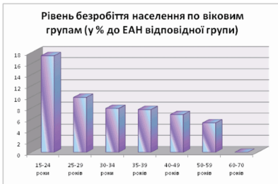
Рисунок 1 – Рівень безробіття населення по віковим групам

Дані стосовного молодіжного безробіття у світі є також невтішними. За інформацією МОП сьгоднішні показники рівня безробіття серед молоді сягають своїх рекордних відміток і складають 40% загального рівня світового безробіття. Рівень безробіття населення по віковим групам подано в діграмі.