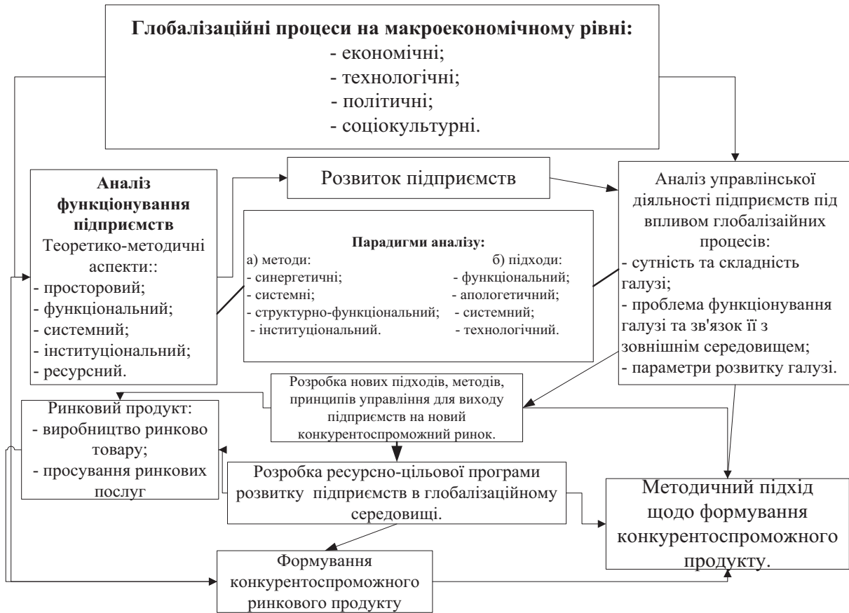
Рисунок 1 – Структурно-логістична схема дослідження Авторська розробка

Вище сказане несе суттєве осмислення сутності глобалізаційних процесів і їх вплив на розвиток підприємств України, тому є актуальним для сьогодення і потребує подальшого дослідження, аналіз якого необхідно представити в логічно-структурну схему рис. 1.