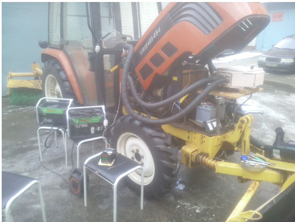
Рисунок 1 – Об'єкт експериментальних досліджень – трактор Foton 454 з дизелем 495BT Figure 1 – The object of experimental research is the Foton 454 tractor with a 495BT diesel engine

На кафедрі двигунів і теплотехніки Національного транспортного університету проведено дослідження впливу підігріву повітря тепловим акумулятором фазового переходу на паливну економічність та екологічні показники дизеля в процесі прогріву. Об'єктом експериментальних досліджень є дизель 495BT трактора Foton 454, який показано на рис. 1.