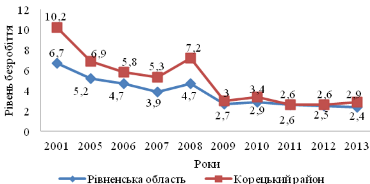
Рис. 2. Рівень зареєстрованого безробіття у Рівненській області та Корецькому районі у 2001-2013 роках (%) [4]

Звичайно, що надлишок пропозиції праці над попитом породжує проблему безробіття. Рівень безробіття у Корецькому районі впродовж 2001-2010 рр. був вищим за обласний, у 2011 р. був таким, як в області, а з 2012 р. знову перевищив рівень області (рис. 2).