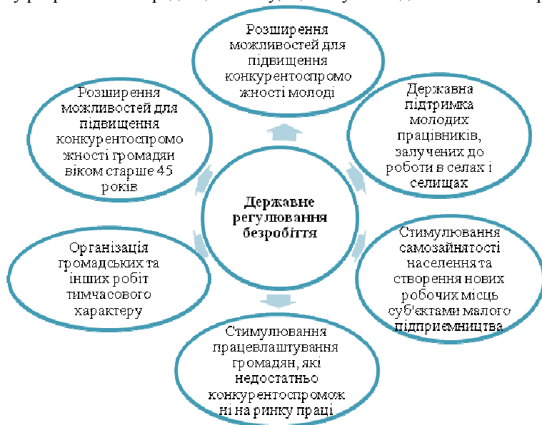
Рис. 3. Напрями державного регулювання зайнятості [1]

Реалізація заходів державного регулювання зайнятості до 1.01.2013 р. (у межах Закону України «Про зайнятість населення» від 1991 р.) в основному була сконцентрована на соціальному захисті безробітних. Натомість, зміни ситуацію на трудонадлишковому ринку праці може лише роботодавець. Розширюючи обсяг попиту, тобто створюючи нові робочі місця. Саме така стратегія була покладена в основу розробки нової редакції Закону, що вступив в дію з 01.01.2013 р.