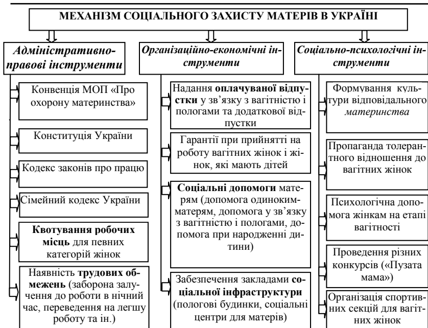
Рис. 2. Механізм соціального захисту матерів в Україні

Важливим адміністративним чинником СЗ матерів є квотування робочих місць. Зокрема, відповідно до Закону України «Про зайнятість населення» в державі передбачено бронювання робочих місць в обсязі 5% середньооблікової чисельності штатних працівників для громадян, які потребують додаткових гарантій у сприянні працевлаштуванню.