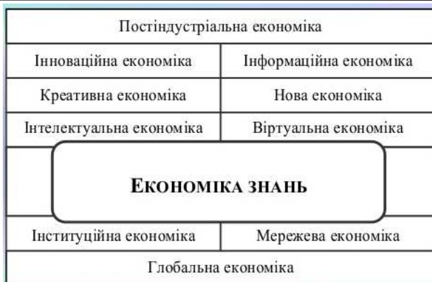
Рис. 2. Пірамідальний генезис економіки знань XXI століття

Економіка знань приносить зміни не тільки зі сторони виробництва, але і зі сторони споживання. А в зв'язку із задоволенням потреб нижчого рівня в таких суспільствах домінуючими стають потреби вищого рівня, які в свою чергу вимагають активного споживання знань. Таким чином, знання за даних умов виступатимуть і в ролі фактора виробництва, і продукту.