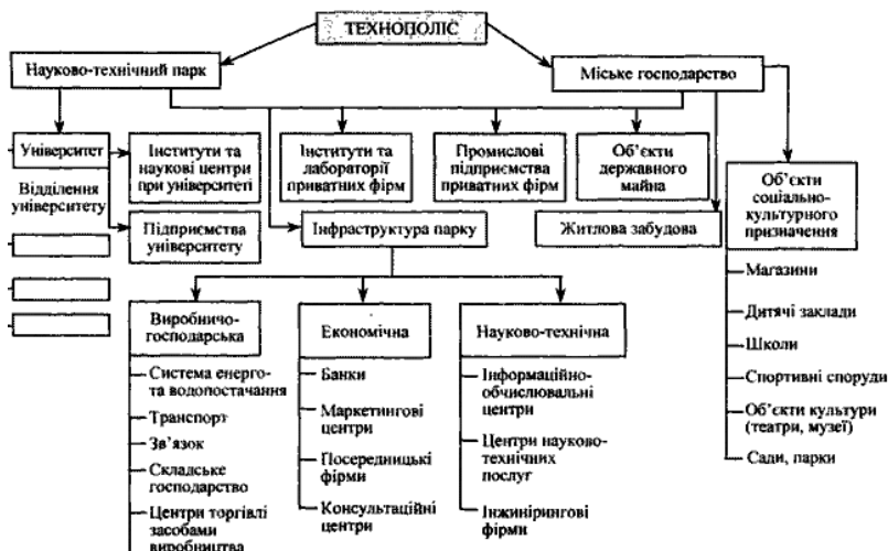
Рис. 1. Організаційна структура Стенфордського університету на основі науково-технічного парку й технополісу

Бурхливий розвиток інноваційних технологій слугує яскравим прикладом того, як у сучасному світі нова технологія може докорінно змінити ситуацію на ринку. Це ще раз підтверджує той факт, що з плином часу активне життя багатьох технологій на ринку значно скорочується й все більша вага відводиться науковим дослідженням, часто емпіричним. Тому вагому роль інновацій у сучасному житті людства підтверджує той факт, що вже друге століття поспіль витрати на науково-дослідницькі й дослідно-конструкторські роботи є вагомою частиною ВВП країн світу (таблиця).