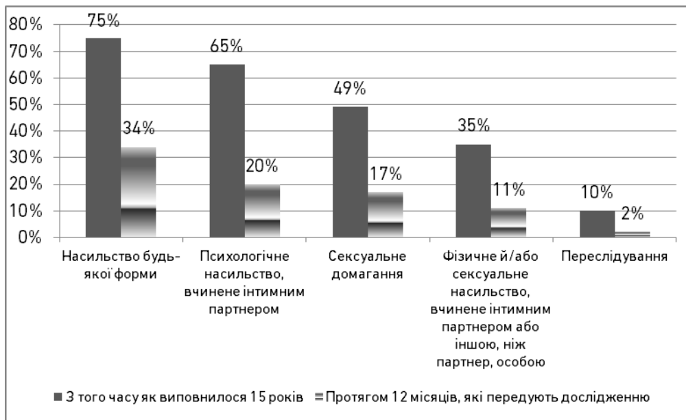
Рис. 1. Рівень поширення різних форм насильства над жінками

Фізичному чи/або сексуальному насильству піддавалась кожна третя жінка. При цьому приблизно чверть жінок в Україні вважає, що домашнє насильство – це особиста справа й має вирішуватись у межах сім'ї (26%). Це вище за середній показник в Європейському Союзі (14%), але нижче за показник сусідньої Румунії (31%). У країнах ЄС показник згоди з таким твердженням варіюється від 2% у Швеції до 31% у Румунії [9]. Це свідчить про існування певних гендерних стереотипів в окремих країнах, а також про те, що у країнах з високим рівнем інформаційної політики щодо питань гендерної рівності жінки виявляють більше бажання говорити про домашнє насильство.