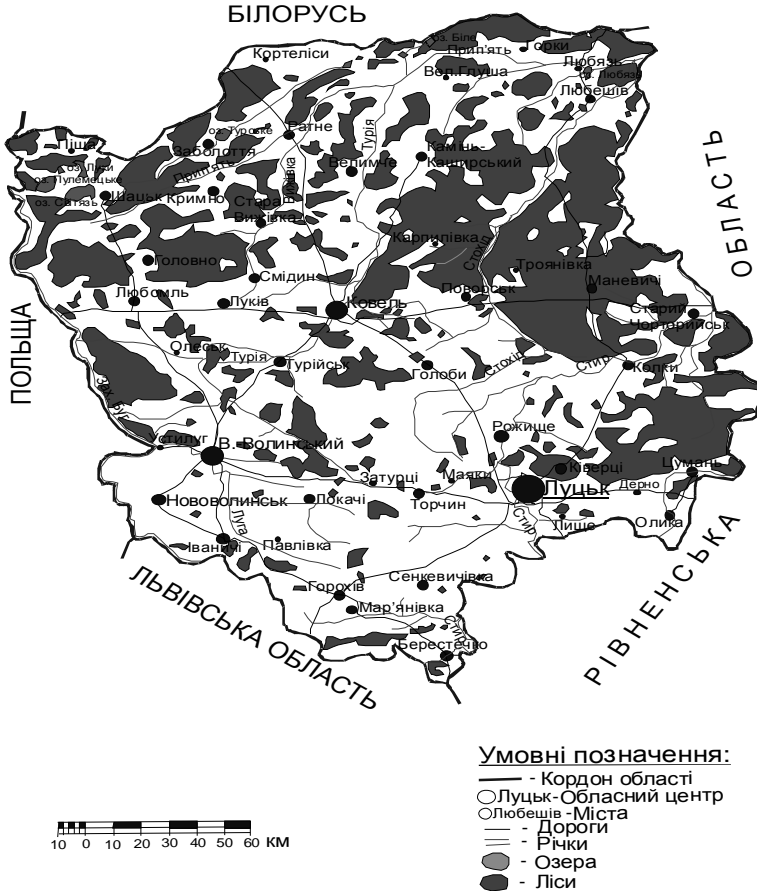
Рис. 1. Ліси Волинської області [7]

– прибалкові й прияружні лісосмуги, що закріплюють ґрунт, сприяють акумуляції твердого стоку, протидіють розмиву ґрунту, поліпшують господарське використання малопродуктивних земель.