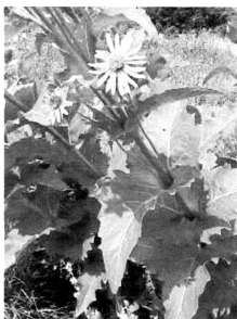
Рис. 3. Фаза цвітіння сільфію