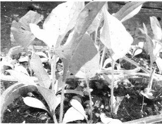
Рис. 1. Розсадний матеріал сільфію пронизанолистого

Результати досліджень. Вплив строків сівби на продуктивність сільфію пронизанолистого. Результатами експериментальних досліджень встановлено, що адаптивна здатність сільфію пронизанолистого в зоні Полісся має високу ступінь. Особливістю можна вважати те, що фактори, які лімітують продуктивність даного виду (густота посіву, обробіток ґрунту, захист від бур'янів на початкових етапах росту) є визначальними у вирощуванні цієї культури. Помічені випадки загибелі рослин або їх дегенерація на переущільнених ділянках ґрунту, біля лісосмуги або лісу.