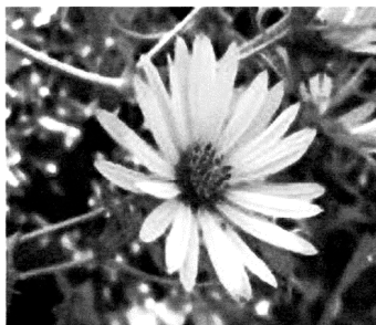
Рис. 4. Суцвіття сільфію

Проведеними у 2012-2013 рр. дослідженнями виявлено, що завдяки екологічній пластичності, продуктивним довголіттям на дерново-підзолистих ґрунтах сільфій виявивсь досить врожайним (695 ц/га). Виявлено, що свіжозібране насіння сільфію мало максимальну лабораторну схожість (96%) та енергію проростання (на 7-й день 45%) при пророщуванні на світлі при +20°C. При пророщуванні в темряві схожість знижувалася на 7-14%; при +35°C сходи гинули, а при +5°C насіння не проростало.