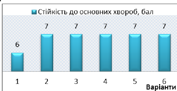
Рис. 2. Стійкість рослин ячменю ярого до основних хвороб

Стійкість рослин до хвороб у досліді визначалася за 9-ти бальною шкалою. Як видно з усереднених за 2 роки досліджень даних, наведених на рис. 2, стійкість ячменю ярого до хвороб на контрольному варіанті – середня (6 балів), а на досліджуваних варіантах – сильна (7 балів).