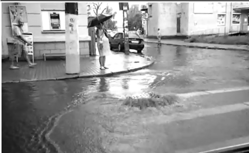
Рис. 3. Затоплення міської вулиці через люк колодязя дощової мережі (м. Житомир, 12.09.2013 р.)

Усунення зазначених недоліків в організації відведення дощових вод з територій населених пунктів вимагає різних за складністю та об'ємами видів робіт. При цьому будь який спосіб буде ефективним тільки за умови належної експлуатації споруд дощової каналізації.