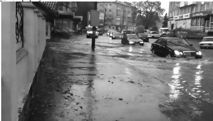
Рис. 1. Затоплення центральної вулиці м. Рівне дощовими водами (13.09.2013 р.)

Влаштовані в містах України відповідно до чинних нормативів [1, 2] системи дощової каналізації не забезпечують передбаченого про-ектами відведення атмосферних вод з міських територій (рис. 1). Осо-бливо це стає помітним в останні роки у зв'язку із глобальними зміна-ми клімату на Землі. Часто має місце невідповідність фактичних ха-рактеристик існуючих споруд дощової каналізації параметрам дощового стоку, що формується в межах басейну каналізування.