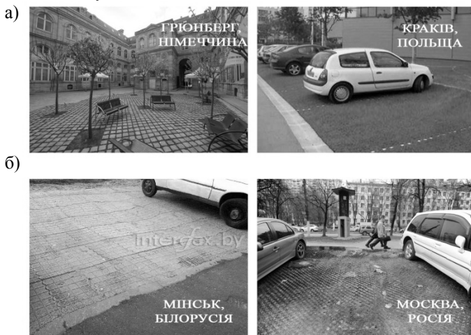
Рис. 1. Приклади влаштування водопроникних покриттів у різних країнах: а) Центральної та Східної Європи; б) Росії та Білорусії

Зважаючи на негативний досвід Росії та Білорусії (див. рис 1, б), а також що в Україні у чинних нормативах відсутні будь-які рекомендації щодо розрахунку, влаштування та експлуатації пористих покриттів, виникає необхідність дослідження даних покриттів, враховуючи кліматичні, топогеодезичні та інші особливості нашої території.