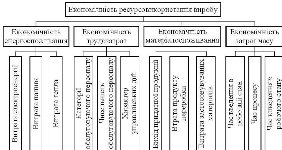
Рис. 3. Групування показників економічності ресурсовикористання виробу

властивості виробу, які визначають ресурсомісткість його функціонування (споживання), тобто ефективність використання ресурсів (матеріалів, енергії, праці, часу), необхідного для безпосереднього використання виробу за призначенням (рис. 3).