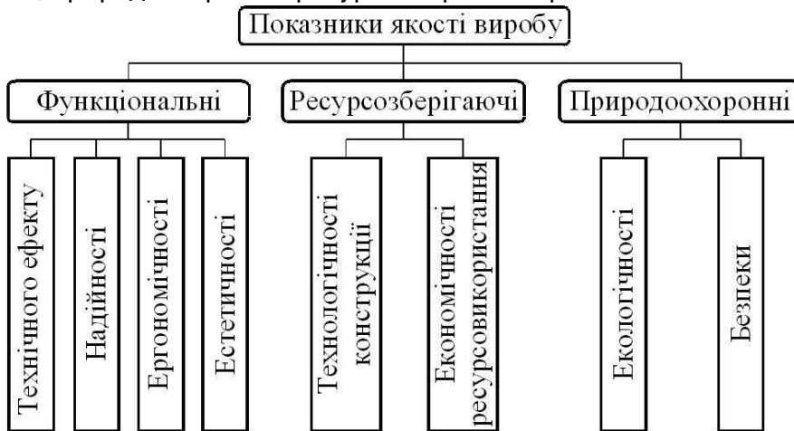
Рис. 1. Схема групування показників якості виробу

В загальному показники якості виробу поділяються на функціональні, природоохоронні і ресурсозберігаючі (рис. 1).