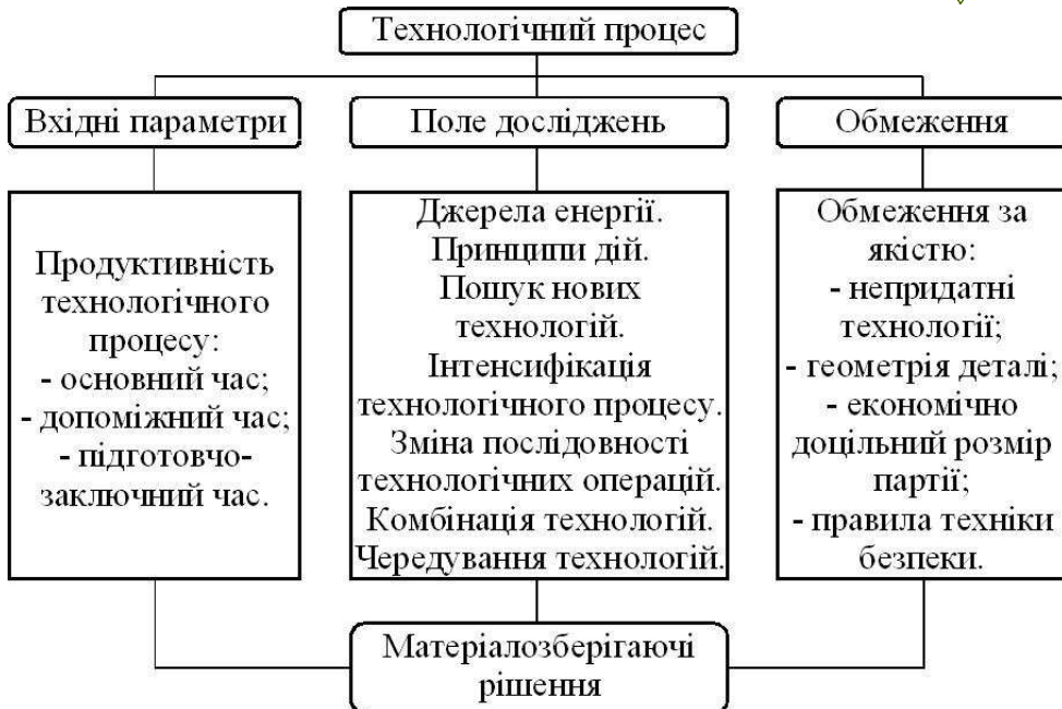
Рис. 4. Схема дослідження технологічних процесів для пошуку оптимальних рішень економії матеріалів

Успішне відпрацювання поставлених завдань дозволить провести ретельний аналіз отриманих результатів і визначити можливості їх використання в подальшій практичній діяльності.