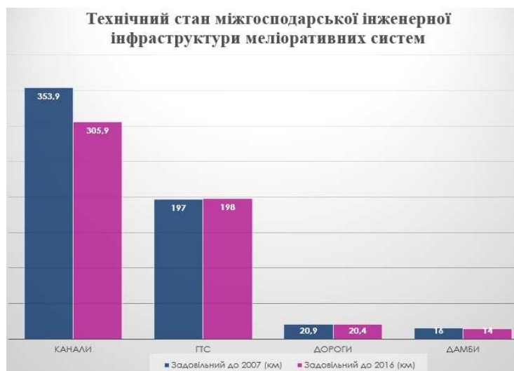
Рис. 1. Гістограми аналізу технічного стану каналів, ГТС, доріг та дамб в динаміці по роках

Якщо більш-менш спостерігається стабільність технічного стану ГТС, доріг, дамб, то, на жаль, з каналами проглядається ситуація погіршення технічного стану.