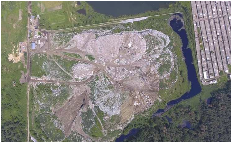
Рис. 1. Місце розташування міського звалища

Однак відсутність вагової на міському полігоні складування ТПВ ставить під сумнів відповідність цієї інформації реальності. На полігоні використовується технологія розрівнювання і ущільнення відходів. Початковий середній коефіцієнт співвідношення маси відходів до їх об'єму (щільність) – 0,27 т/м 3 твердих побутових відходів. Ущільнення відходів досягається багаторазовим проходженням бульдозерів по шару ТПВ висотою не більше 0,5 м, що дає змогу зменшити об'єм відходів в 3,7 рази. Організація робіт на полігоні передбачає карткове складування ТПВ. Під'їзні дороги до робочих карт на міському полігоні знаходяться в незадовільному стані та потребують капітального ремонту.