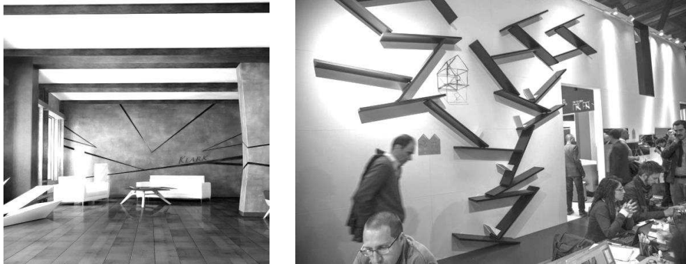
Рис. 2. Приклади рішень інтер'єрів в стилі деконструктивізму

Можливо це одна із причин, через яку деконструктивізм мало поширений в архітектурі та мистецтві України, і зустрічається лише в поодиноких рішеннях інтер'єрів (рис. 2). Для створення подібних об'єктів потрібна належна підготовка та фінансова підтримка професійних кадрів з боку держави, допомога молодим архітекторам, які можливо знаходяться в творчому пошуку і здатні принести щось нове в архітектуру. Прикладом такої політики є провідні країни світу, що вже мають зразки деконструктивізму в будівництві та активно продовжують його розвивати, зокрема: США, Німеччина, Іспанія, Ав-