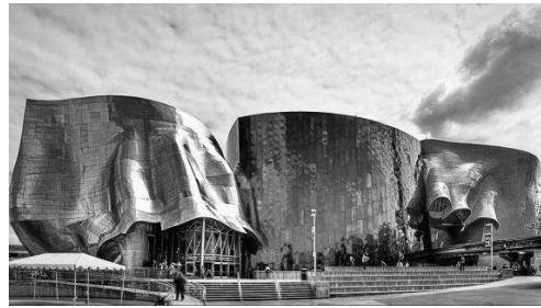
Рис. 1. Приклади споруд в стилі деконструктивізму:

1 – Королівський музей провінції Онтаріо в Торонто; 2 – кінотеатр UFA-Palast в Дрездені; 3 – музей Гугенхайма в Більбао; 4 – музей музики в Сієтлі