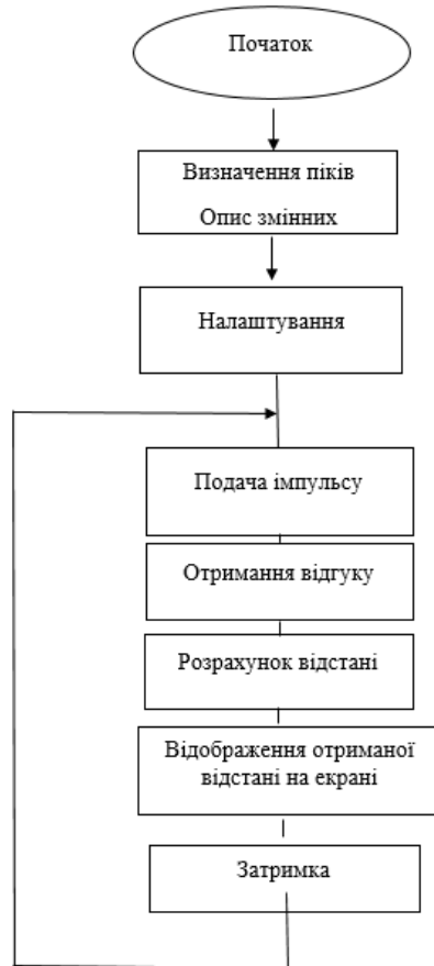
Рис. 2. Блок-схема алгоритму розробленого пристрою

Після складання пристрою на основі наведеної структурної схеми та перевірки його, було розроблено блок-схему алгоритму функціонування майбутнього пристрою (рис. 2).