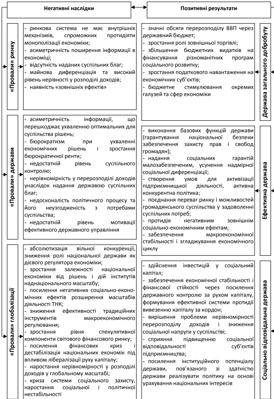
Рис. 1. Еволюція економічних функцій держави