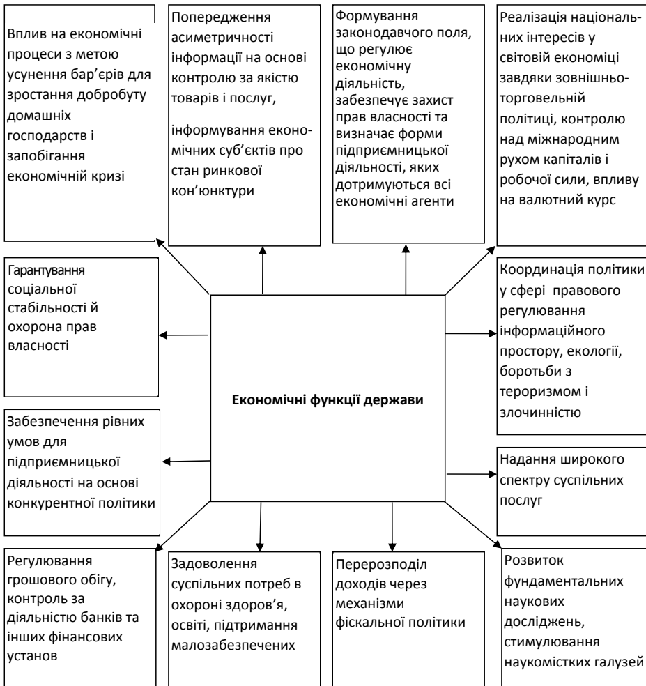
Рис. 2. Основні напрями реалізації економічних функцій держави

– переорієнтація економічної політики з урахуванням глобальних викликів шляхом виходу за межі стабілізаційного впливу та формування ґрунтовних засад конкурентоспроможної національної економіки [6, с. 14–16].