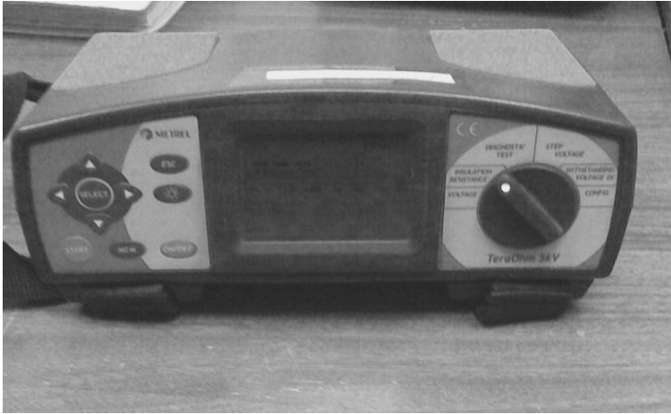
Рис.2. Тераомметр METREL MI2077

Сущность метода заключается в экспериментальном определении зависимости ресурса покрытия \tau от температуры и концентрации агрессивной среды испытанием образцов в каждом испытательном режиме до отказа покрытия, с последующей экстраполяцией \tau в область рабочих значений температуры и концентрации. Критерием отказа (предельным состоянием покрытия) является снижение электрического сопротивления покрытия до величины приведенного сопротивления разрушения ( R_{пр.кр} ). Для определения значения приведенного электрического сопротивления покрытия в предельном состоянии (предельное сопротивление разрушения) проводят измерения в одном из наиболее жестких режимов до отказа всех образцов и находят зависимость электрического сопротивления каждого образца от продолжительности испытания.