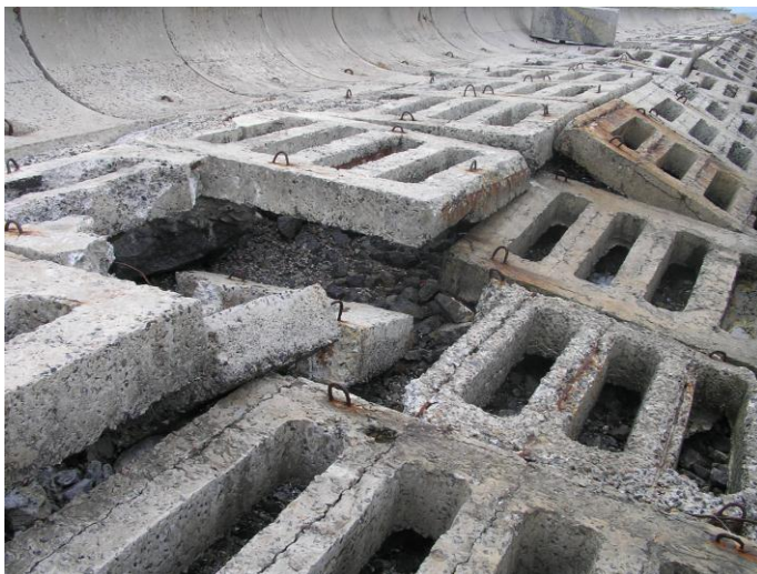
Рис.1. Техническое состояние берегозащиты Большого Фонтанского мыса

В настоящей работе рассмотрено берегозащитное сооружение с камерой гашения /2/. При этом была поставлена задача создать эффективную и долговечную конструкцию для защиты берегов. Конструкция берегозащитного сооружения с камерой гашения представлена на рис. 2. Берегозащитное сооружение включает короб 1, который состоит из верхней части 2 с элементами внешней шероховатости в виде разных по высоте выступов 3, образующими полуконическую поверхность, каждый выступ перфорирован отверстиями в виде усеченного конуса 4, прямоугольными отверстиями 5 и перепускными окнами 6, расположенными в боковых стенках 7 верхней части короба, нижней части 8, оборудованной прямоугольными выступами 9, попеременно примыкающими к боковым стенкам 10 и щелями 11 переменного по высоте сечения. Берегозащитное сооружение снабжено упорным массивом 12, контрфильтром 13, волноотбойной стенкой 14.