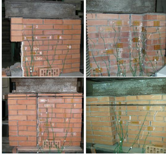
Рис.2. Зразки С1.1-3, С2.2-3, С3.1-3, С3.3-3 після випробувань